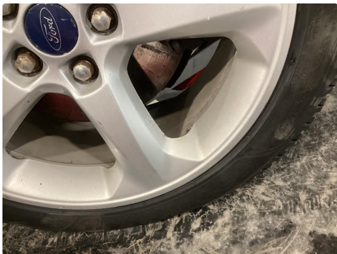
1.5 Skade på felg