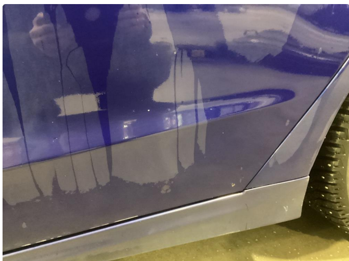
1.1 Noen riper og småbulker