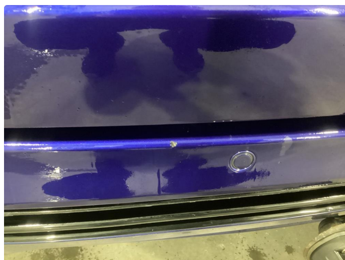
1.1 Noen riper og småbulker