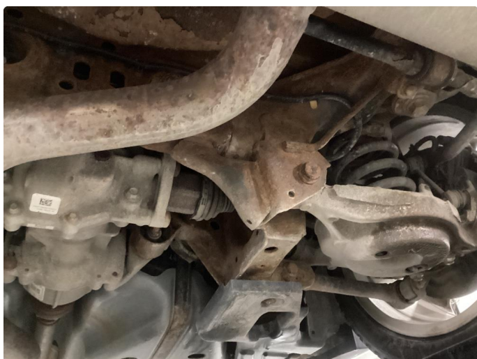
1.2 En del overflaterust