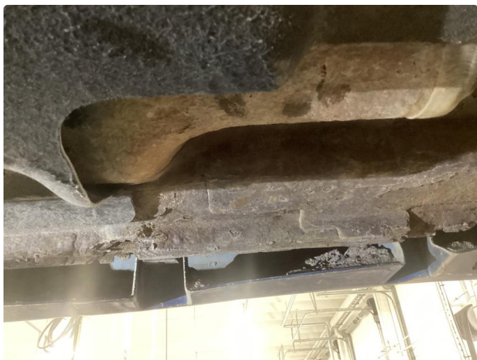
1.3 En del overflaterust