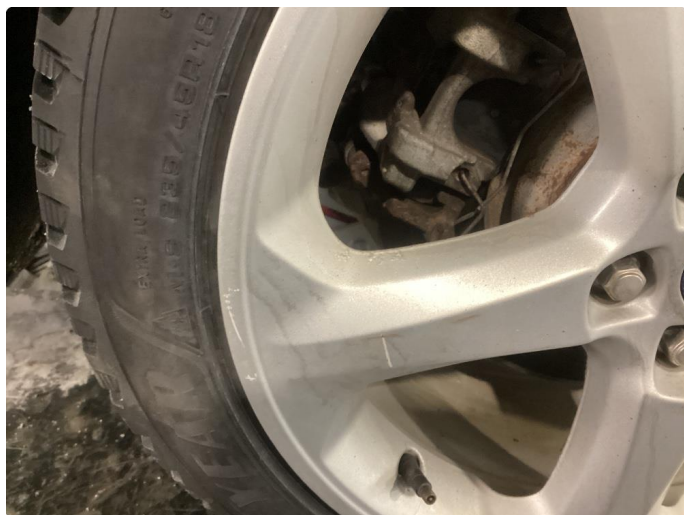
1.5 Skade på felg