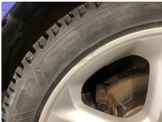
1.4 Skade på felg