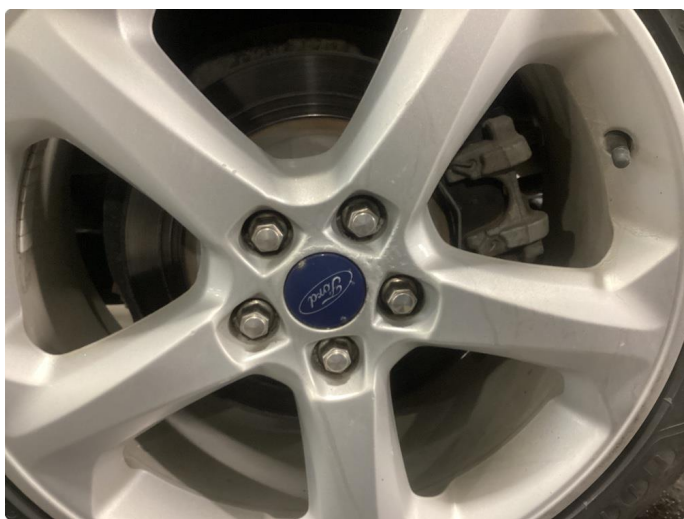
1.5 Skade på felg