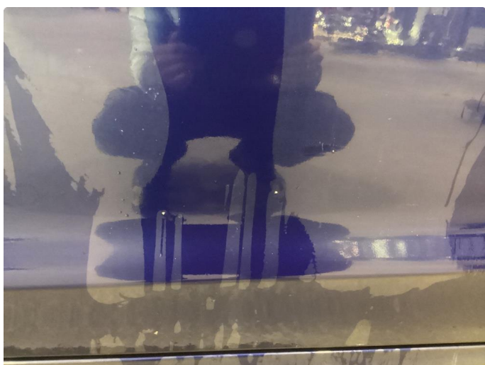
1.1 Noen riper og småbulker