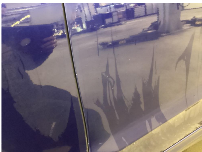
1.1 Noen riper og småbulker