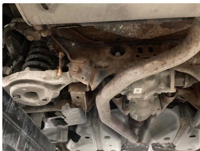
1.2 En del overflaterust