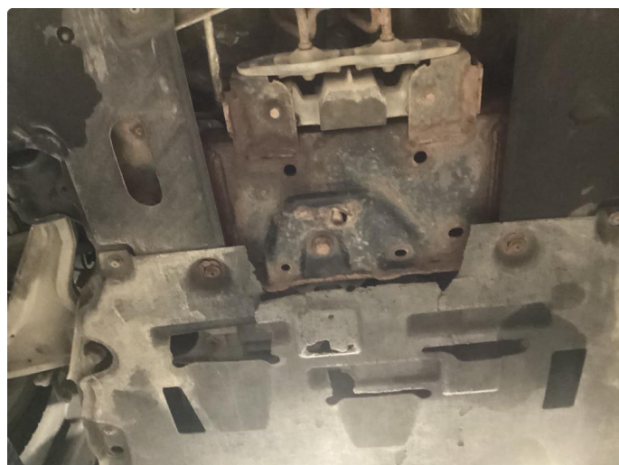
1.2 En del overflaterust