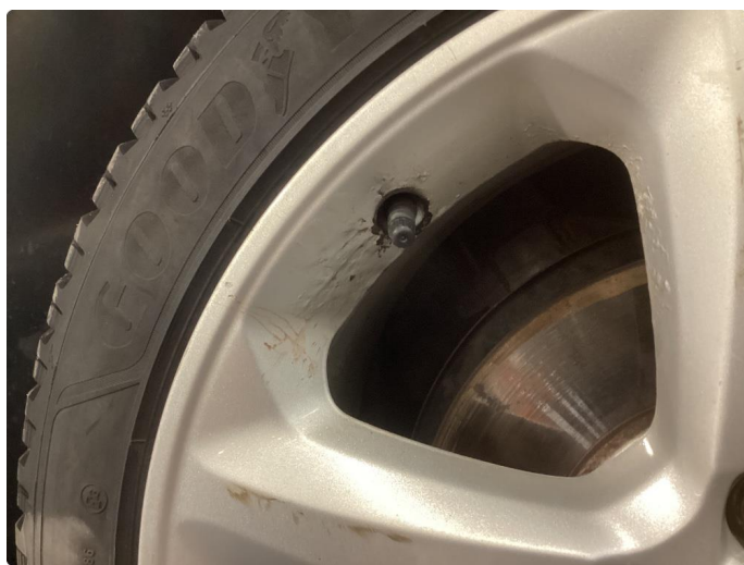
1.5 Skade på felg