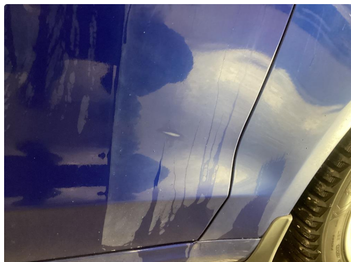
1.1 Noen riper og småbulker