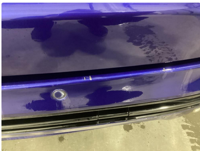
1.1 Noen riper og småbulker