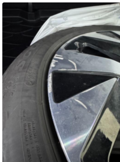
1.4 Noe kantkjørt sommerfelg.