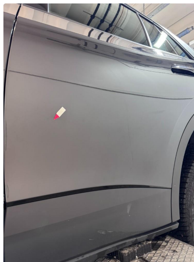
1.2 Steinsprut med korrosjon.