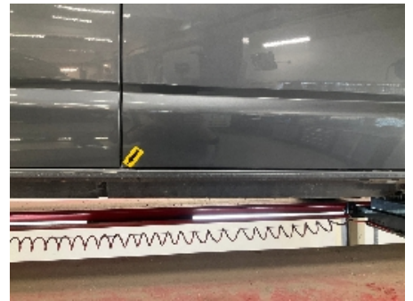
18. Høyre fordør