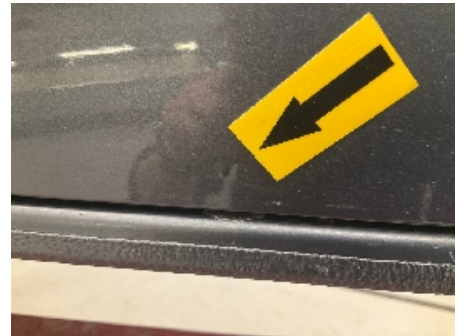
21. Høyre bakdør