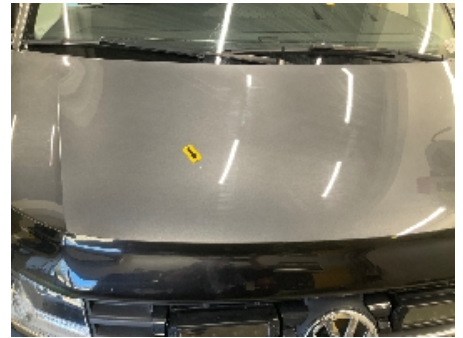
3. Karosseri generelt