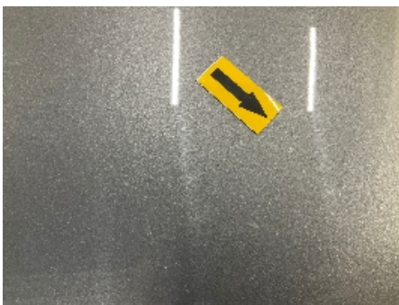
4. Karosseri generelt