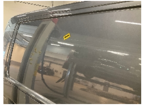
15. Høyre bakskjerm