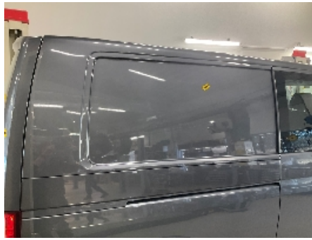
14. Høyre bakskjerm