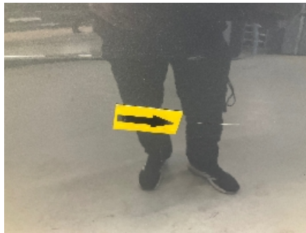
17. Høyre bakdør