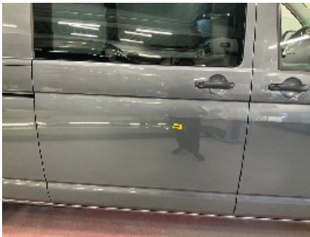
16. Høyre bakdør