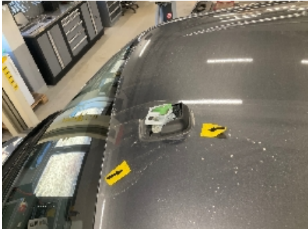
7. Radio / Multimedia