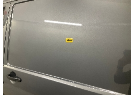
9. Venstre bakdør