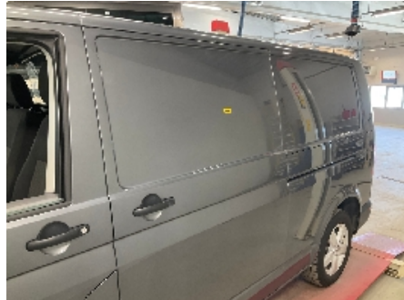
8. Venstre bakdør