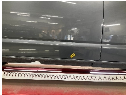
20. Høyre bakdør