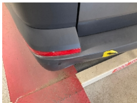
11. Støtfanger bak