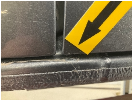
19. Høyre fordør