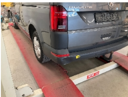
10. Støtfanger bak