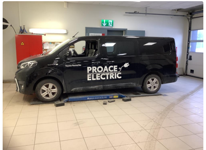
2.1 Fjerne dekor/logo