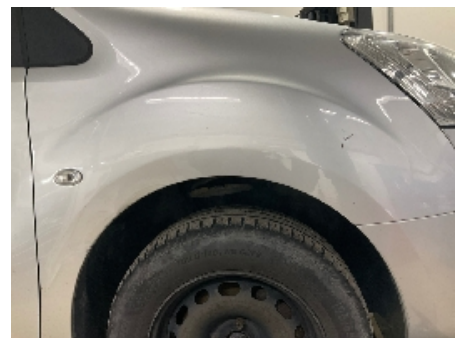
6. Lakk / karosseri utvendig