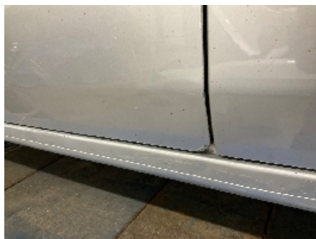
8. Lakk / karosseri utvendig