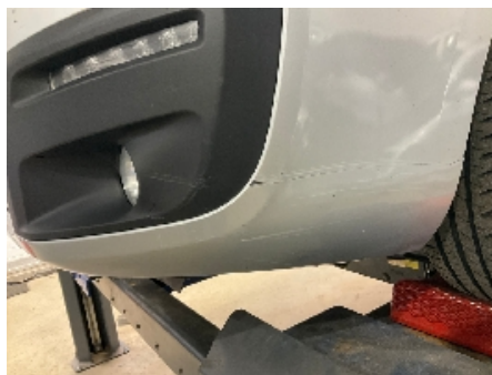
5. Lakk / karosseri utvendig