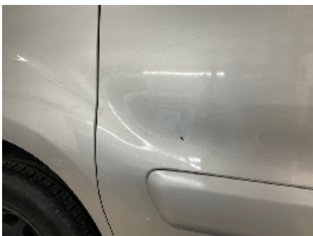
7. Lakk / karosseri utvendig