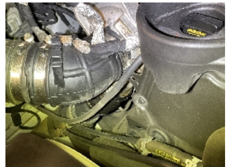
21. Utvendig tilstand motor