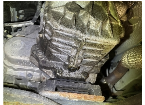
30. Girkasse (manuell)