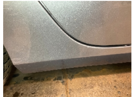
3. Lakk / karosseri utvendig