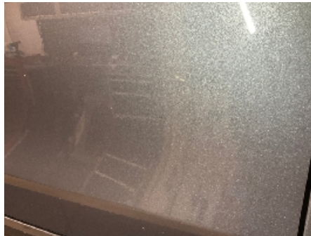
2. Lakk / karosseri utvendig