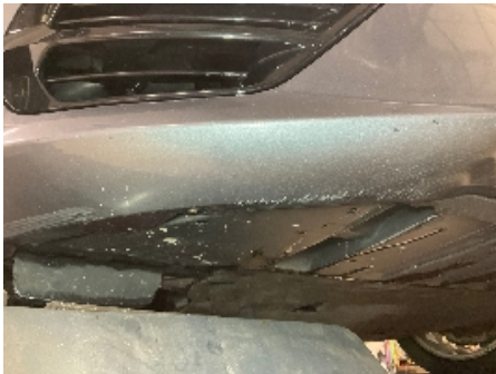
1. Lakk / karosseri utvendig