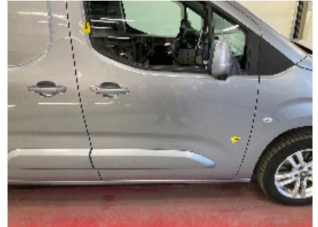
9. Lakk / karosseri utvendig