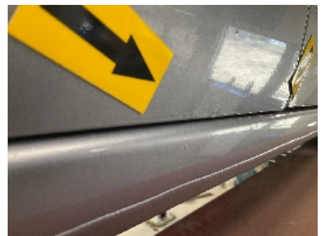
24. Lakk / karosseri utvendig