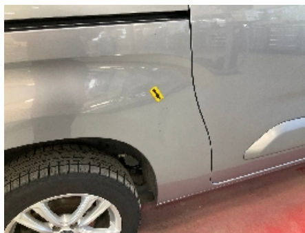
5. Lakk / karosseri utvendig