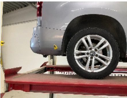
19. Lakk / karosseri utvendig