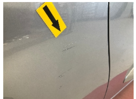
6. Lakk / karosseri utvendig