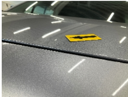
2. Lakk / karosseri utvendig