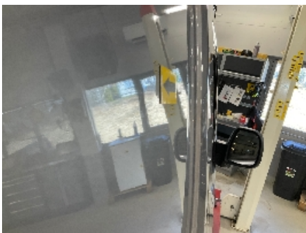
4. Lakk / karosseri utvendig