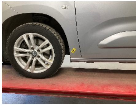
14. Lakk / karosseri utvendig