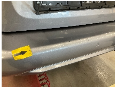
17. Lakk / karosseri utvendig