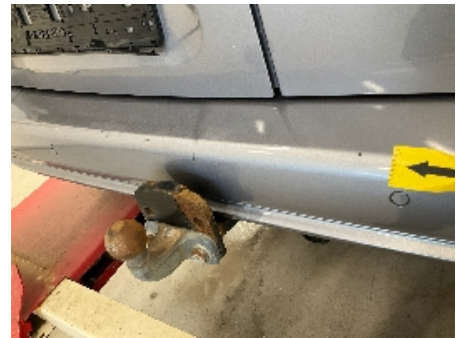
18. Lakk / karosseri utvendig