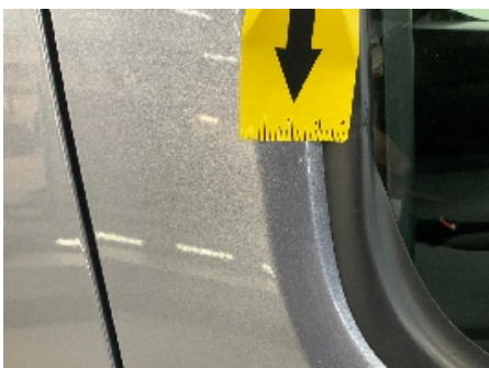
10. Lakk / karosseri utvendig