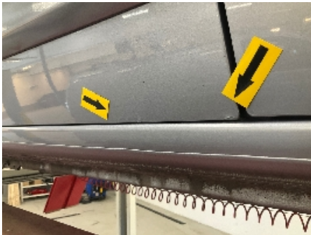
25. Lakk / karosseri utvendig