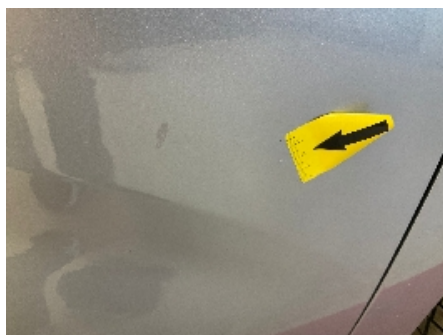
11. Lakk / karosseri utvendig