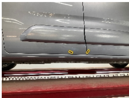
23. Lakk / karosseri utvendig