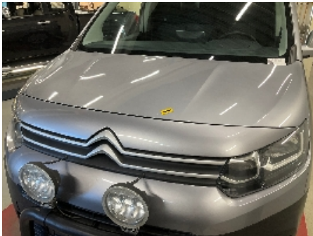
1. Lakk / karosseri utvendig