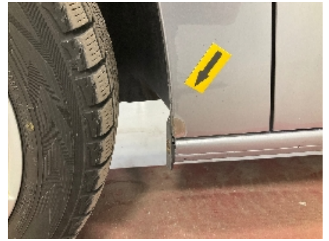
15. Lakk / karosseri utvendig