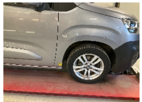
12. Lakk / karosseri utvendig