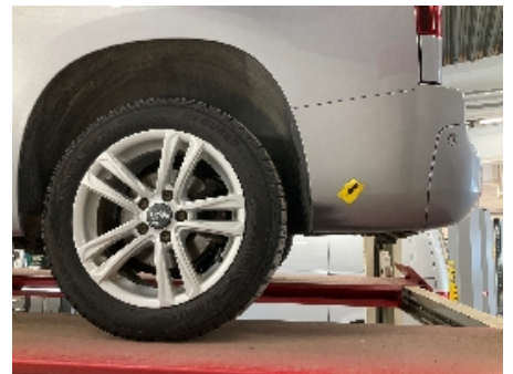
21. Lakk / karosseri utvendig