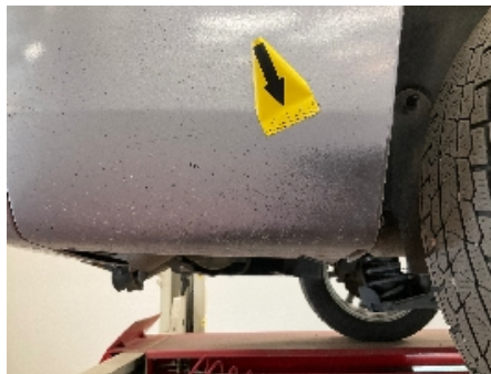
20. Lakk / karosseri utvendig