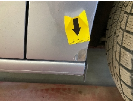
13. Lakk / karosseri utvendig