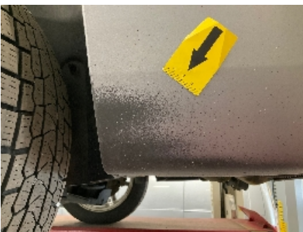
22. Lakk / karosseri utvendig