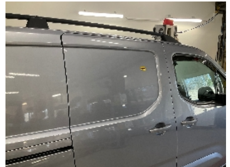
3. Lakk / karosseri utvendig