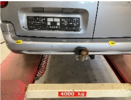
16. Lakk / karosseri utvendig