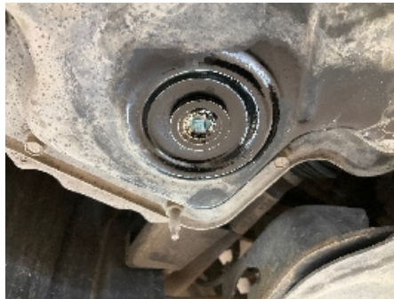
26. Utvendig tilstand motor