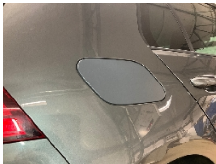
5. Lakk / karosseri utvendig