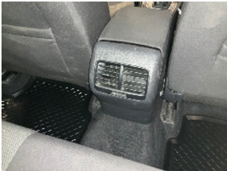
1. Luftdyse kupé