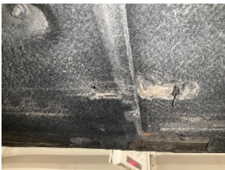
7. Utv. tilstand fremdriftsbatteri elbil/hybrid