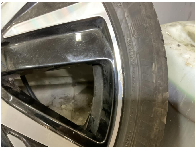
1.3 Lite merke på den ene sommerfelgen