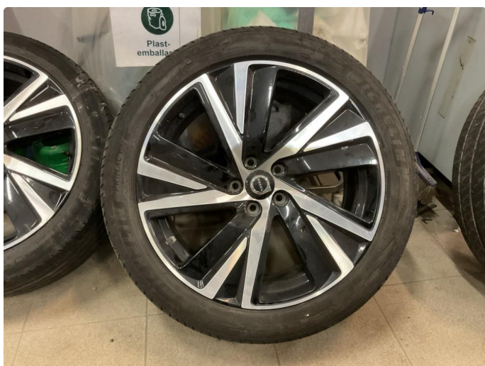
1.2 Bilder av sommerhjul