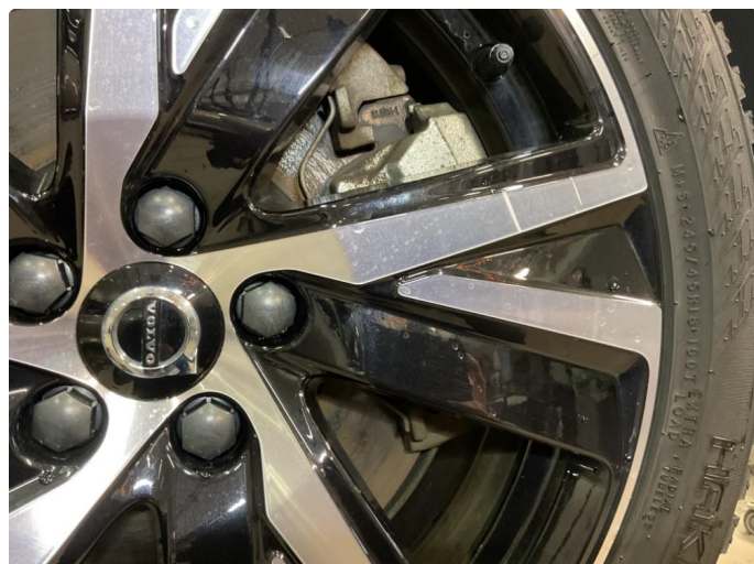
1.1 Små merke/riper på 2x vinterhjul.