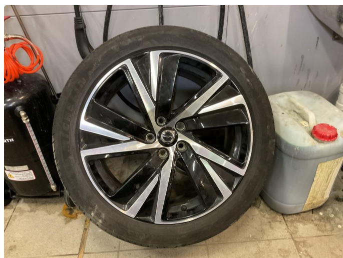
1.2 Bilder av sommerhjul