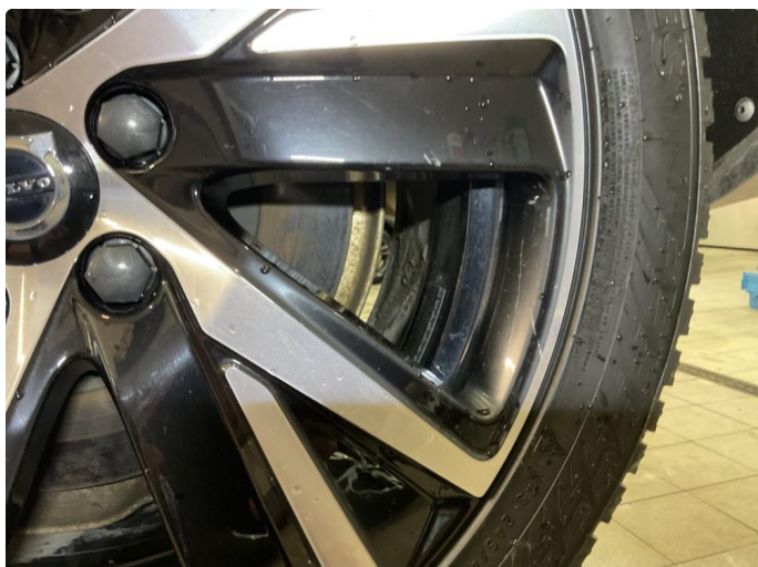
1.1 Små merke/riper på 2x vinterhjul.