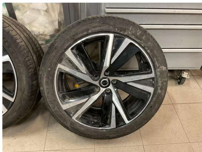
1.2 Bilder av sommerhjul