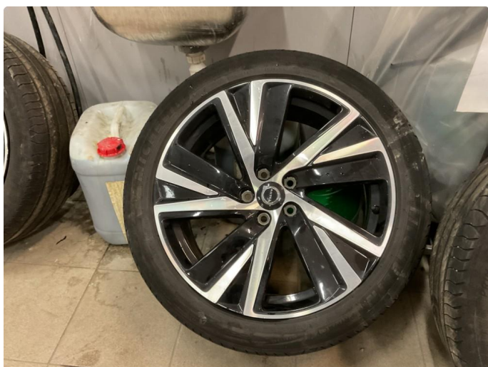
1.2 Bilder av sommerhjul