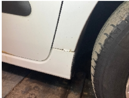
2. Lakk / karosseri utvendig