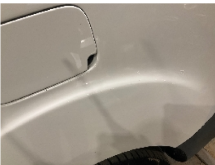
4. Lakk / karosseri utvendig