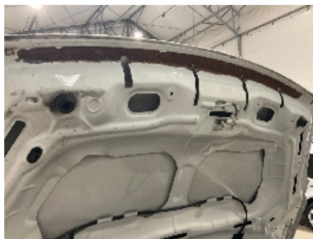
5. Lakk / karosseri utvendig