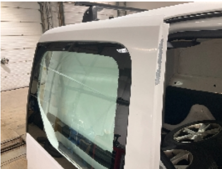
1. Lakk / karosseri utvendig