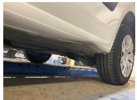
6. Lakk / karosseri utvendig