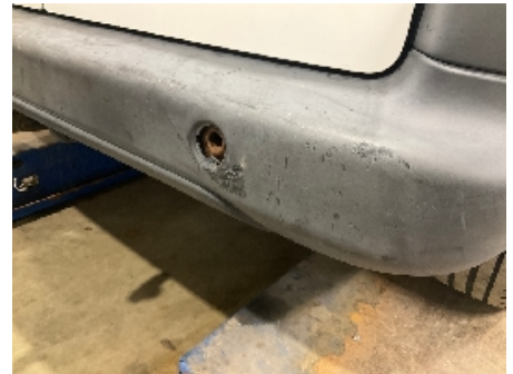
3. Lakk / karosseri utvendig