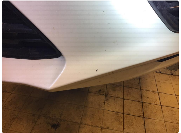
1.2 Steinsprut. normal bruk