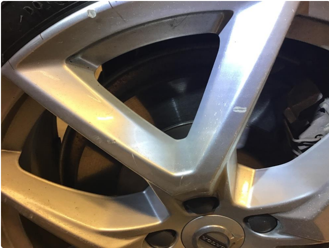
1.1 Skade på felg, normal bruk