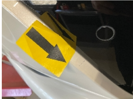
8. Støtfanger foran