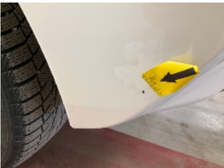
10. Lakk / karosseri utvendig