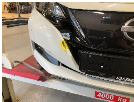
5. Lakk / karosseri utvendig