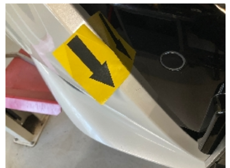
6. Lakk / karosseri utvendig