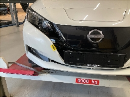
7. Støtfanger foran