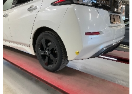
9. Lakk / karosseri utvendig