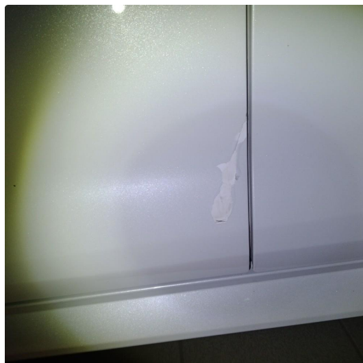
1.3 Lakk flasser