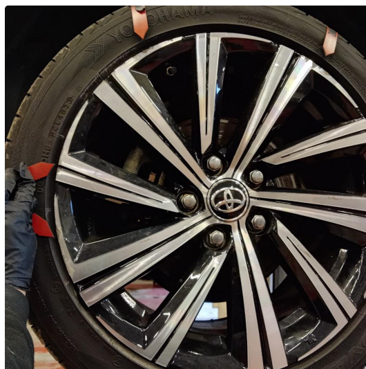
1.5 En kantkjørt felg og en felg med riper (8000kr)