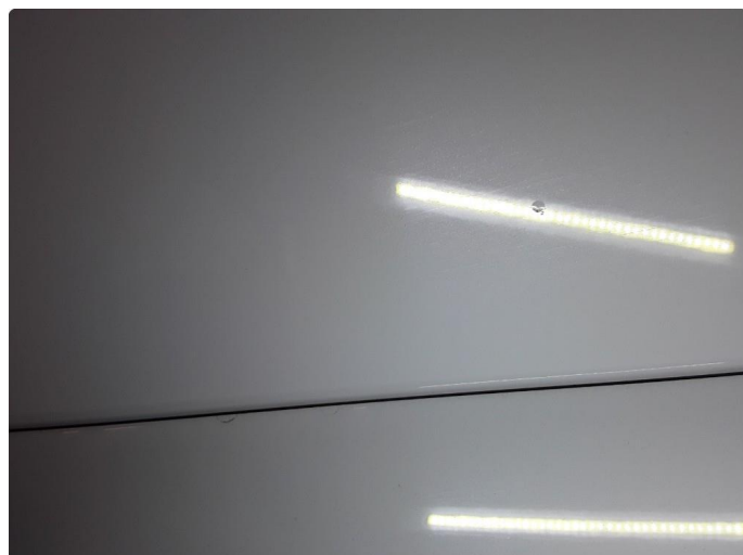
1.3 Steinsprut med korrosjon.