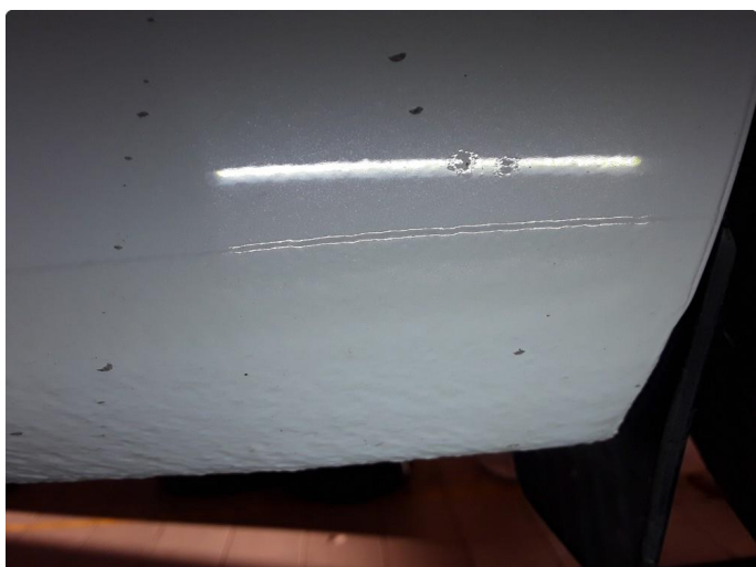
1.4 Steinsprut med korrosjon.