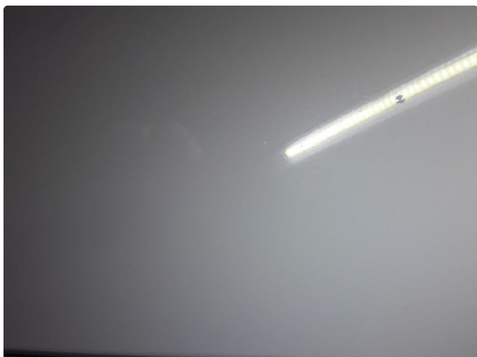
1.2 Steinsprut med korrosjon.