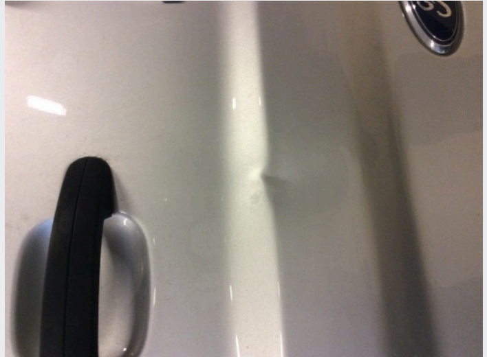
2.1 Bulk høyre bakdør