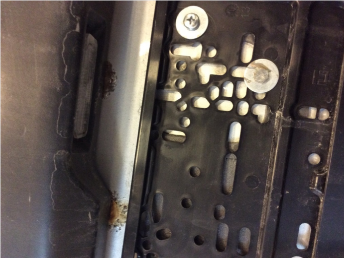
2.1 Rust rundt skiltlysholder.