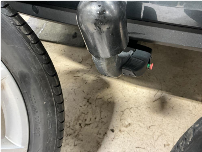
1.1 Utløserknapp for avtagbart hengerfeste sitter fast. SELGES SOM FAST HENGERFESTE.