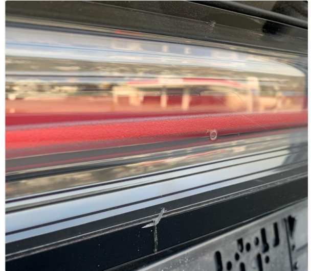
2.1 Liten sprekk i midtre baklampe.