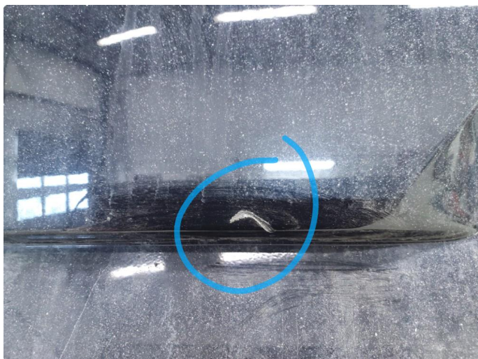
1.4 Ripe(r) ned til grunning på plastikken