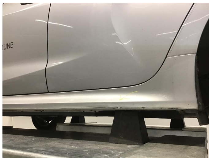
1.8 Ripe(r) ned til grunning