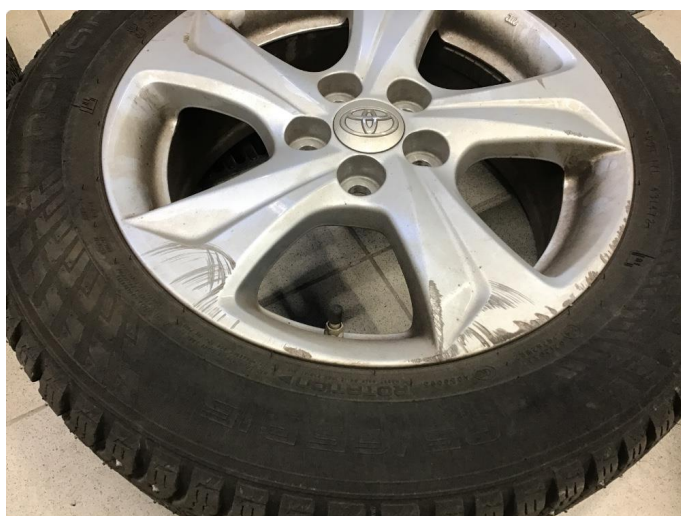
1.5 Kantkjørt felg