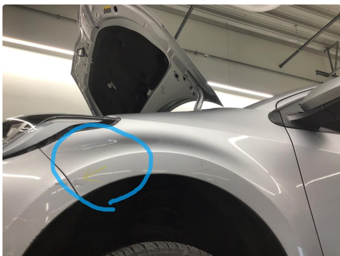
1.3 Bulk med lakkskade