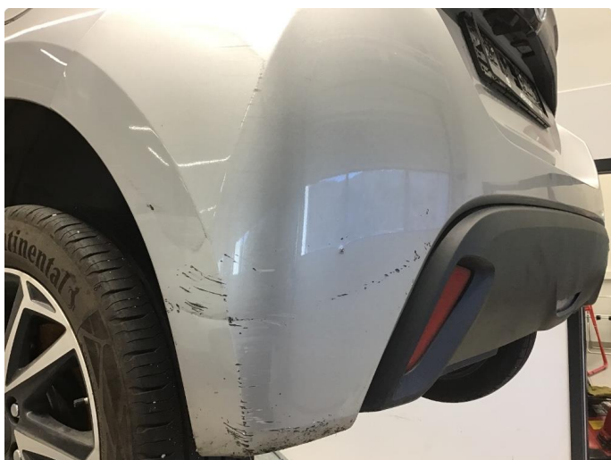
1.7 Ripe(r) ned til grunning