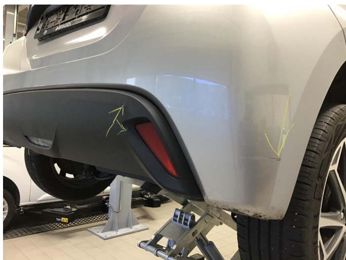
1.7 Ripe(r) ned til grunning