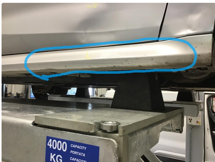
1.8 Ripe(r) ned til grunning