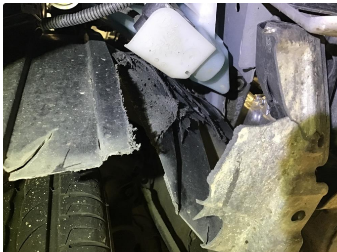
1.2 Plastinnerskjerm skadet