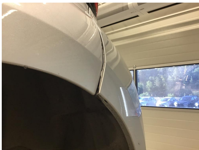
1.7 Ripe(r) ned til grunning