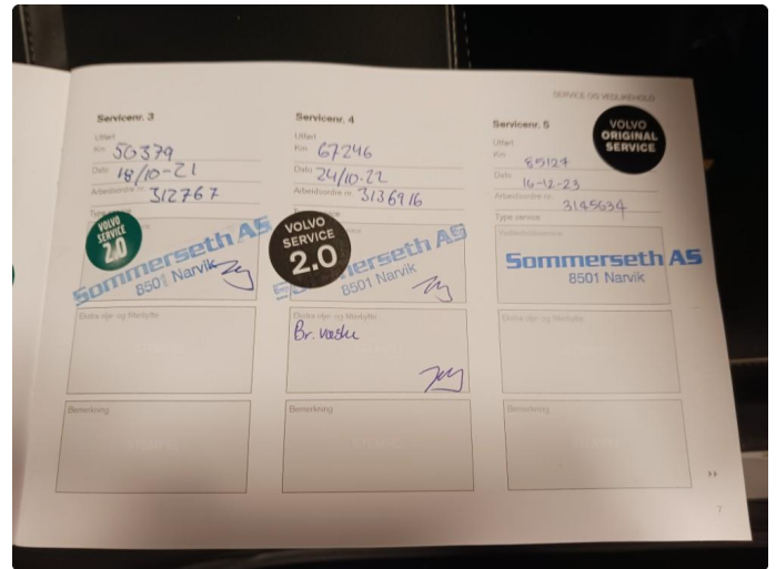
1.1 Dokumentert service, se bilde