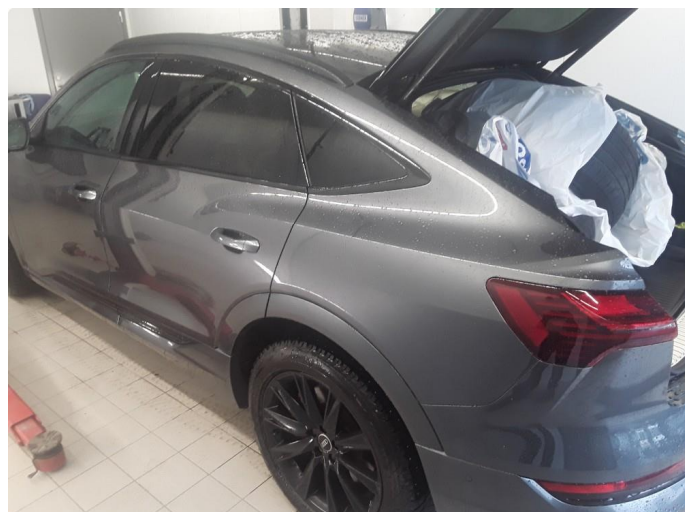
1.1 SOS varsling