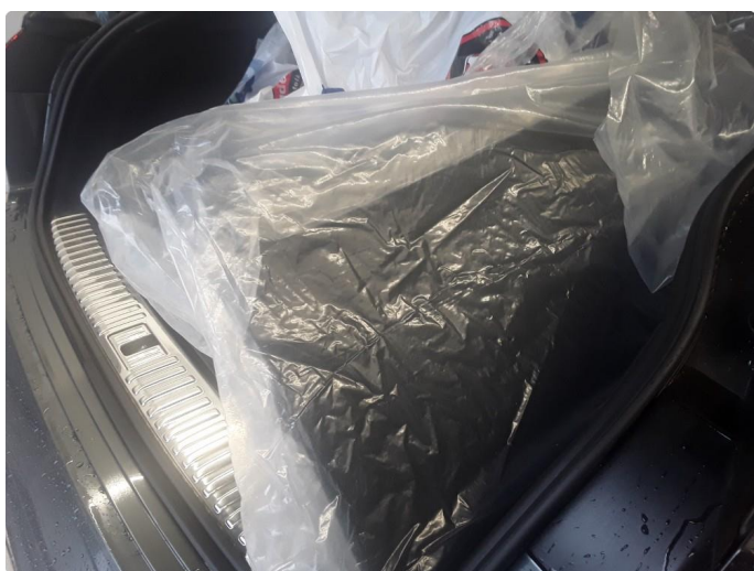
1.1 SOS varsling