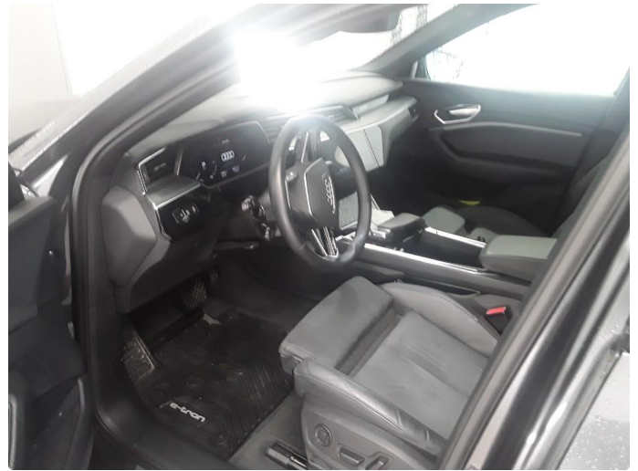
1.1 SOS varsling