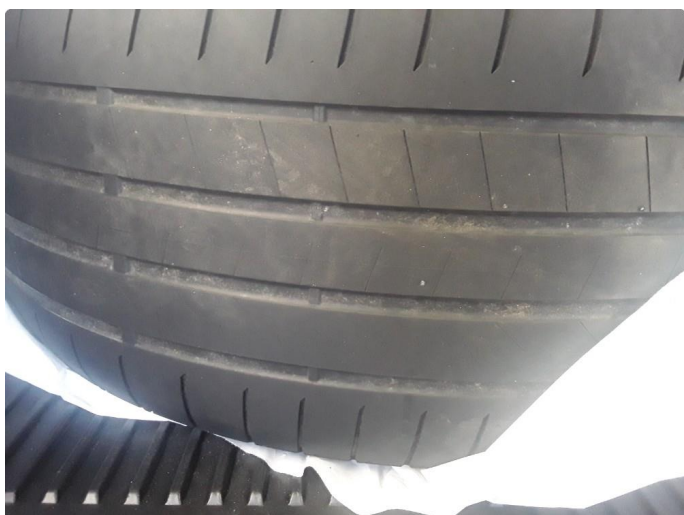
1.1 SOS varsling