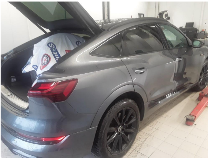
1.1 SOS varsling