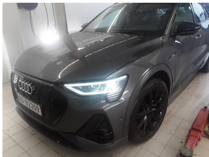
1.1 SOS varsling