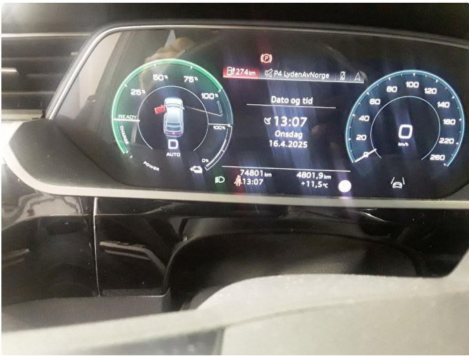
1.1 SOS varsling