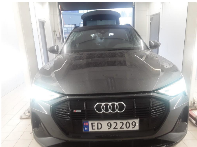
1.1 SOS varsling