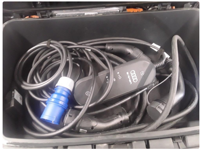
1.1 SOS varsling