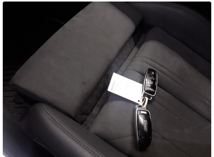
1.1 SOS varsling