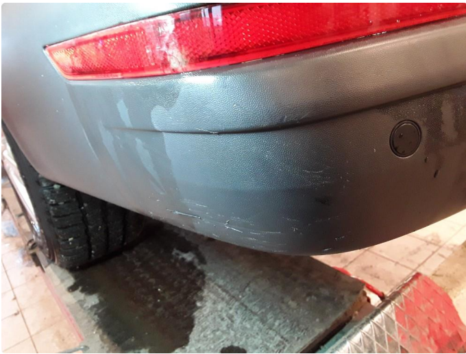
1.5 Noe riper og sår.