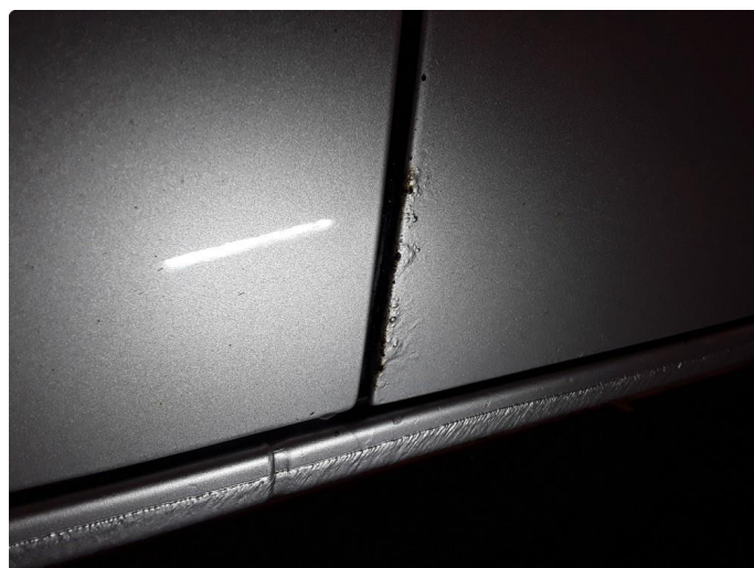
1.3 Steinsprut med korrosjon.