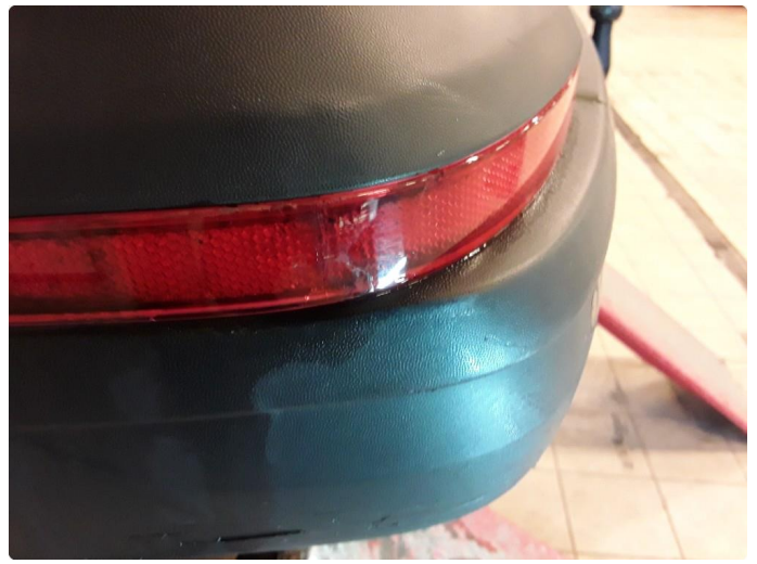
1.5 Noe riper og sår.