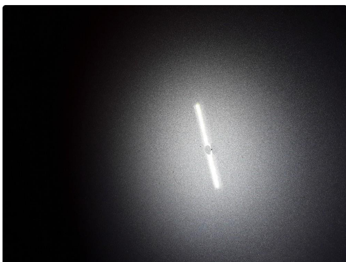
1.3 Steinsprut med korrosjon.