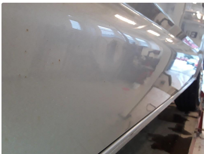
1.3 Steinsprut med korrosjon.