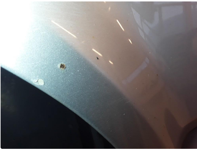
1.4 Steinsprut med korrosjon.