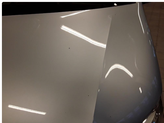
1.2 Noe steinsprut og bulk.