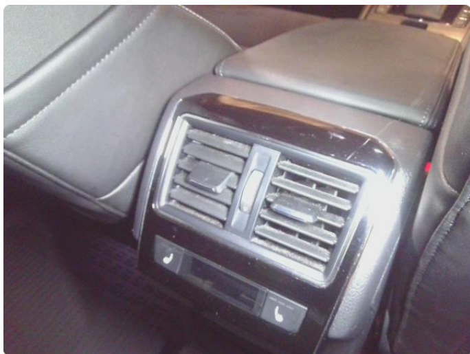
2.1 Skadet luftventil