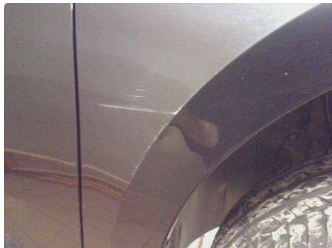
1.2 Bulk med lakkskade