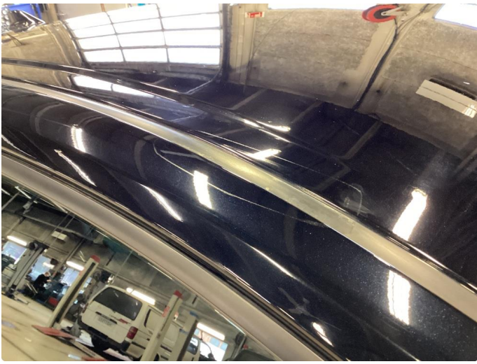
1.3 Merker etter takstativ.