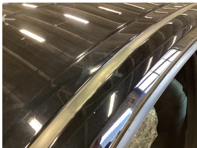
1.3 Merker etter takstativ.