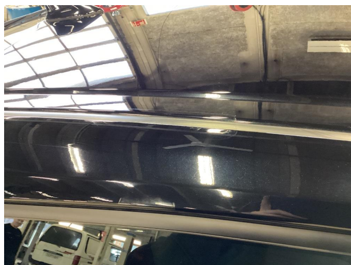
1.3 Merker etter takstativ.