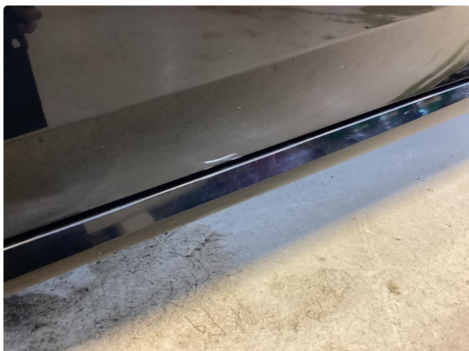
1.1 Ripe sjåfør dør