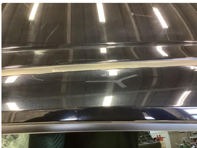
1.3 Merker etter takstativ.