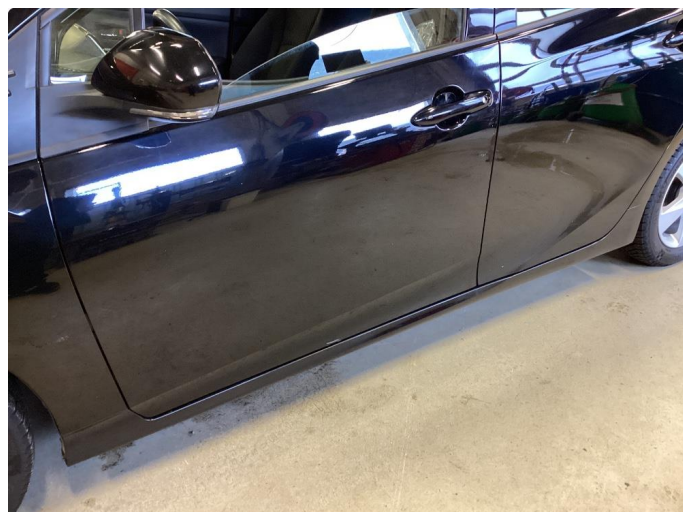
1.1 Ripe sjåfør dør