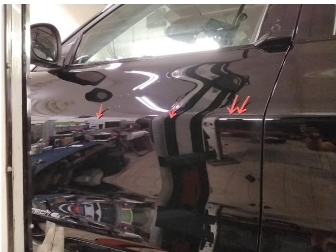
1.1 Flere p-bulker - utført