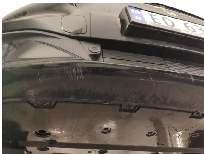
1.3 Skrubbskader underkant