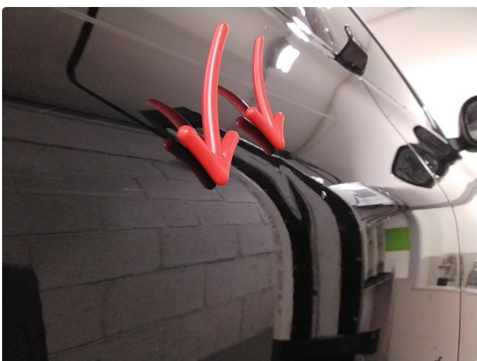
1.2 Flere p-bulker - utført