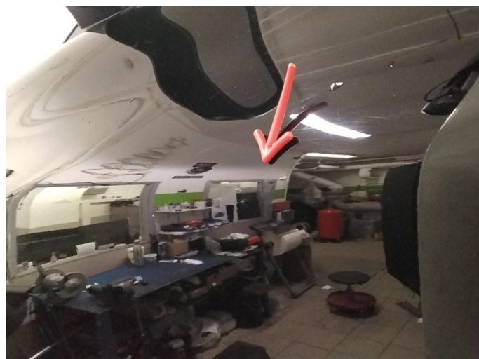
1.1 Flere p-bulker - utført