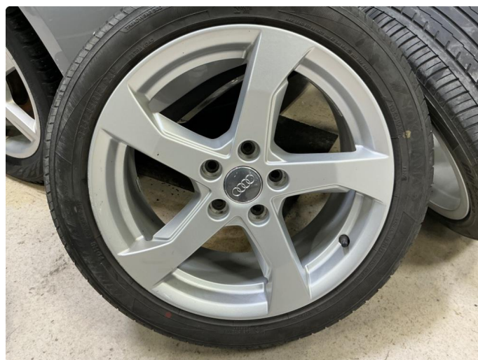
1.5 Kosmetisk skade på alle sommerfelgene