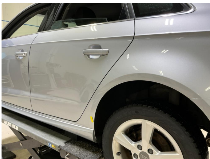
1.3 Blære v.bakskjerm.