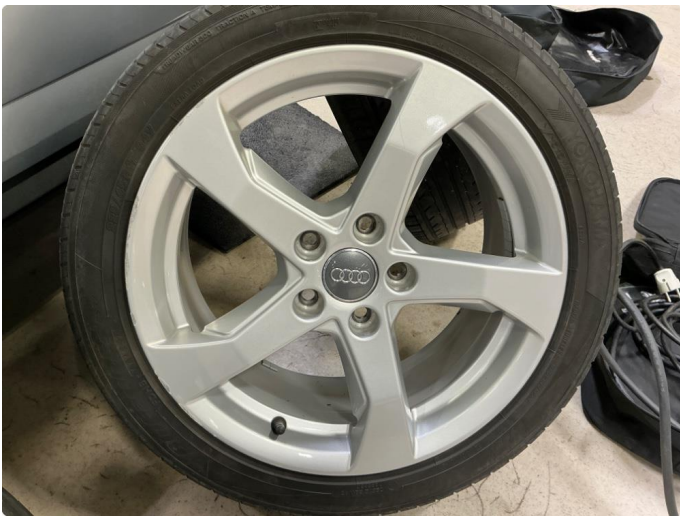
1.5 Kosmetisk skade på alle sommerfelgene