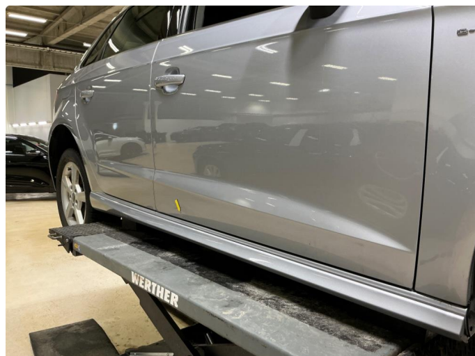
1.2 Liten bulk h.fd.