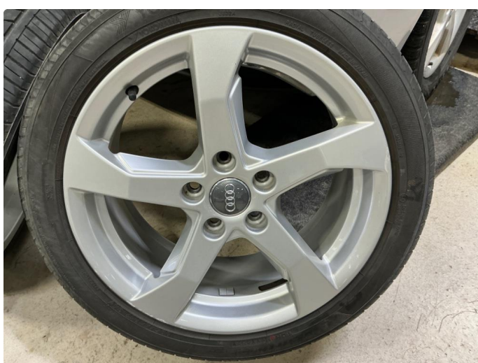
1.5 Kosmetisk skade på alle sommerfelgene