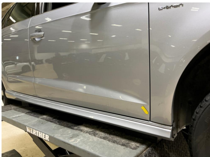
1.1 Blærer forkant h.fordør