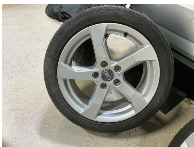
1.5 Kosmetisk skade på alle sommerfelgene