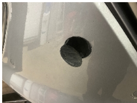
8. Lakk / karosseri utvendig