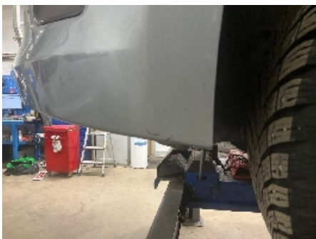
7. Lakk / karosseri utvendig