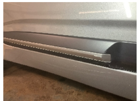
6. Lakk / karosseri utvendig