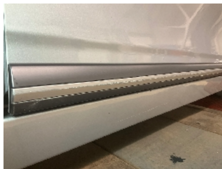
5. Lakk / karosseri utvendig