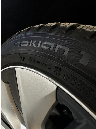
1.1 Bruksmerker på felg