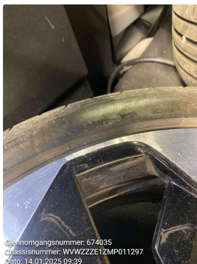
1.4 Kantkjørt felg