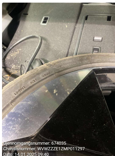
1.4 Kantkjørt felg