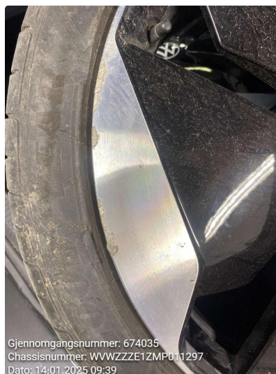
1.4 Kantkjørt felg