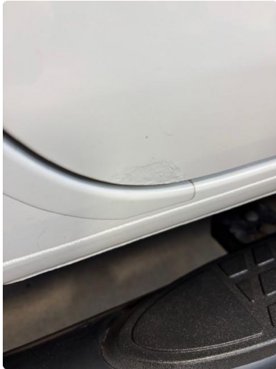
1.1 Lakkflick høyre bakdør