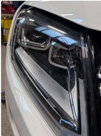
2.2 Noe kakkelering, leve med