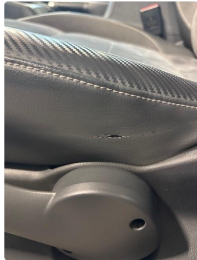
3.1 Rift førerstol