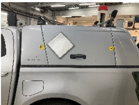
7. Lakk / karosseri utvendig