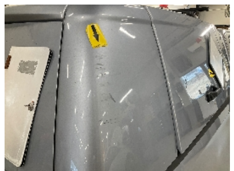
24. Lakk / karosseri utvendig