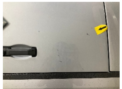
9. Lakk / karosseri utvendig