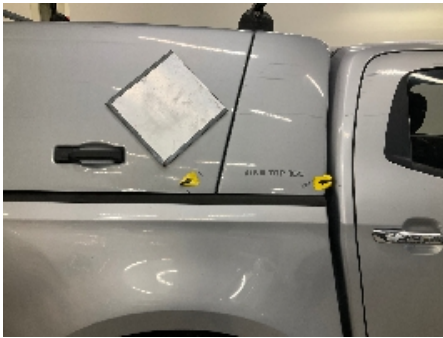
25. Lakk / karosseri utvendig