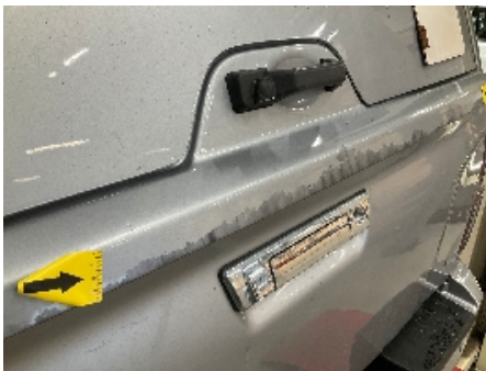
19. Lakk / karosseri utvendig