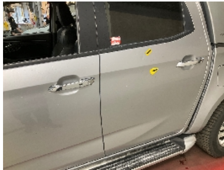
5. Lakk / karosseri utvendig