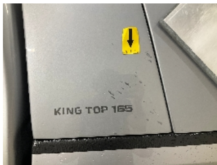
8. Lakk / karosseri utvendig