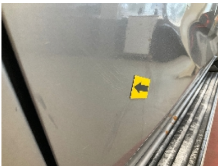
28. Lakk / karosseri utvendig