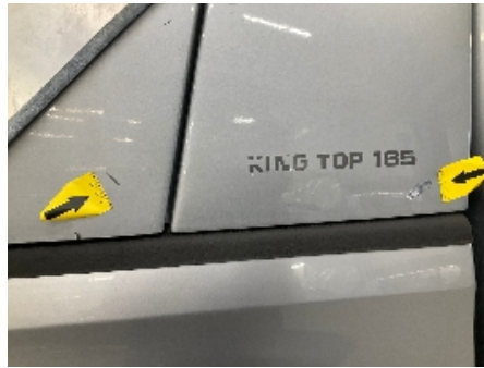
26. Lakk / karosseri utvendig