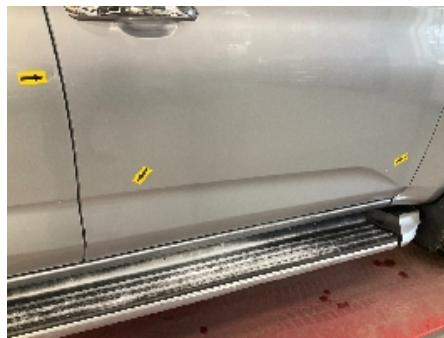
29. Lakk / karosseri utvendig