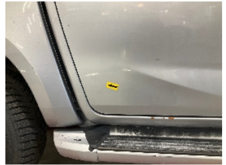
27. Lakk / karosseri utvendig