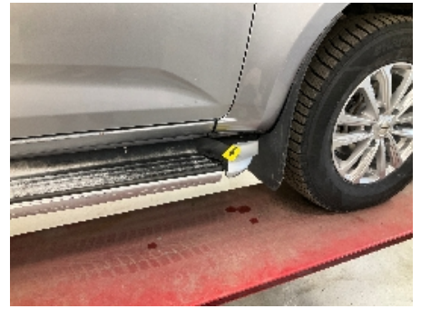
39. Lakk / karosseri utvendig