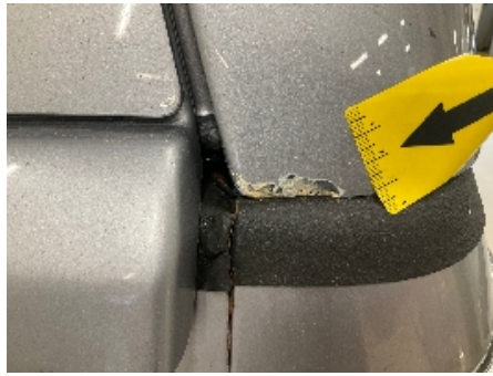
14. Lakk / karosseri utvendig