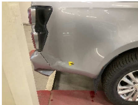
20. Lakk / karosseri utvendig