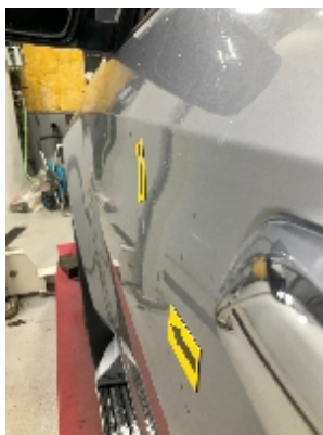
4. Lakk / karosseri utvendig