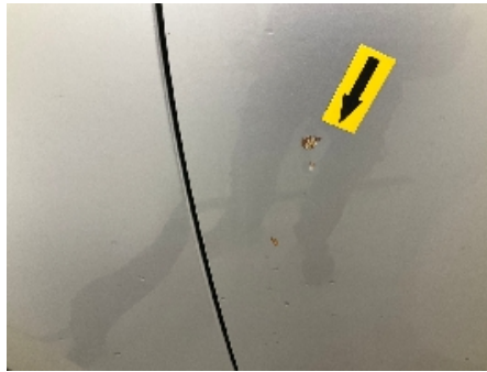
2. Lakk / karosseri utvendig