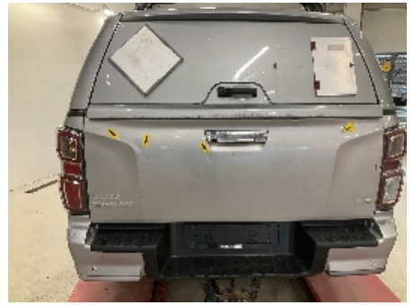
15. Lakk / karosseri utvendig