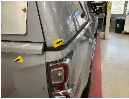
13. Lakk / karosseri utvendig