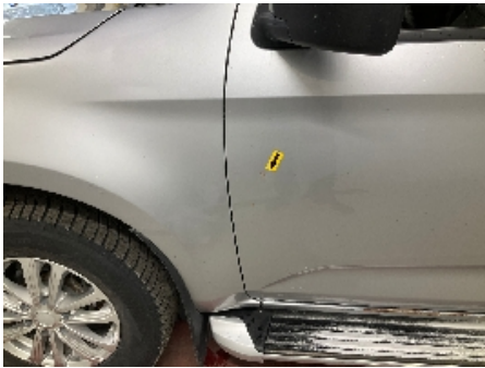
1. Lakk / karosseri utvendig