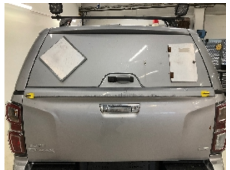
18. Lakk / karosseri utvendig