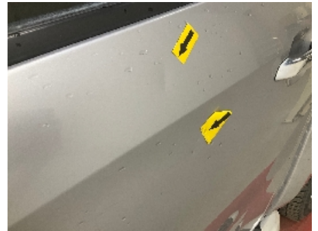
6. Lakk / karosseri utvendig