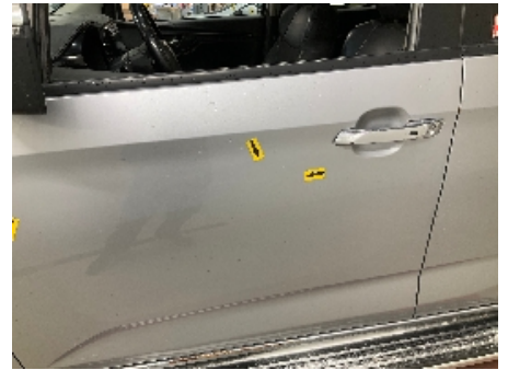
3. Lakk / karosseri utvendig