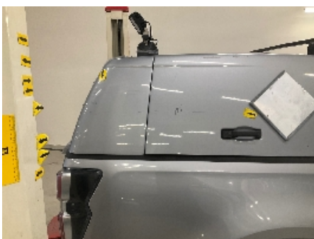
22. Lakk / karosseri utvendig