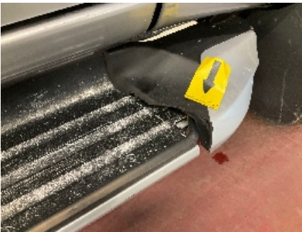
40. Lakk / karosseri utvendig