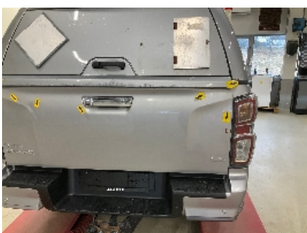
10. Lakk / karosseri utvendig