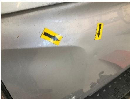
16. Lakk / karosseri utvendig