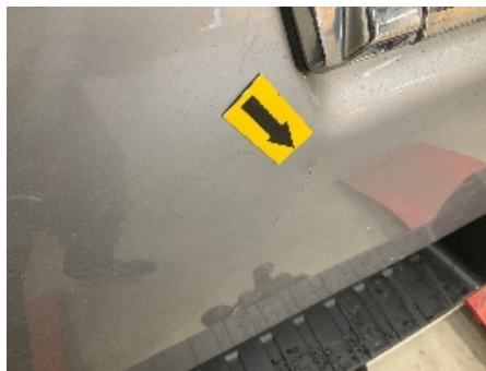
17. Lakk / karosseri utvendig