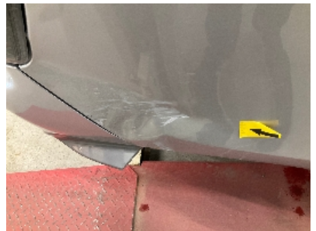
21. Lakk / karosseri utvendig