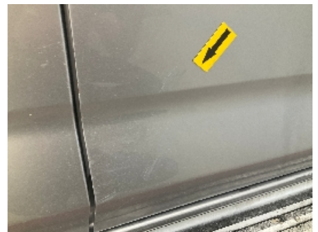
30. Lakk / karosseri utvendig