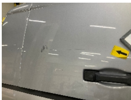
23. Lakk / karosseri utvendig