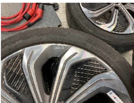
22. Ekstra hjulsett