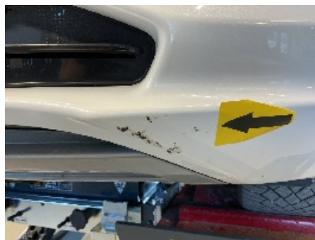
35. Lakk / karosseri utvendig