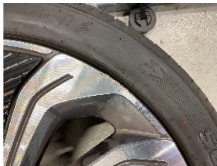
17. Ekstra hjulsett