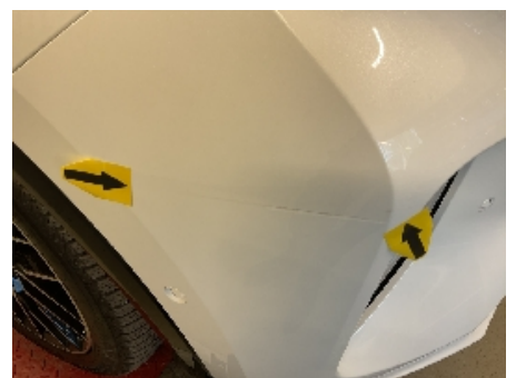
24. Lakk / karosseri utvendig