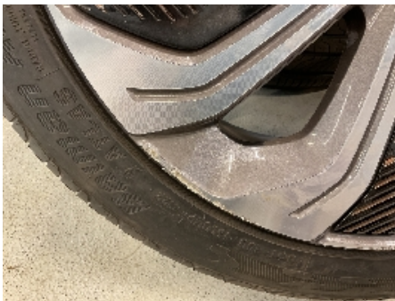
19. Ekstra hjulsett