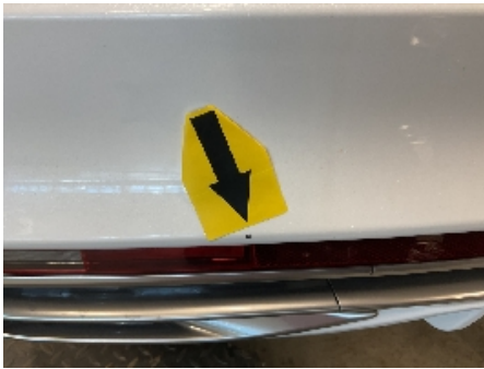
25. Lakk / karosseri utvendig