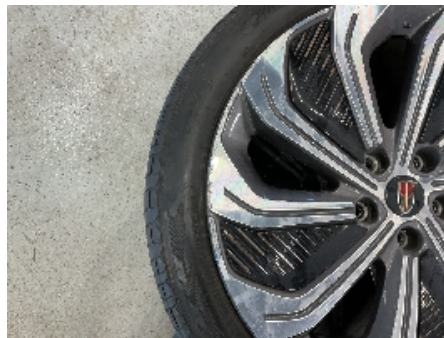
20. Ekstra hjulsett