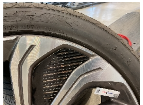
18. Ekstra hjulsett