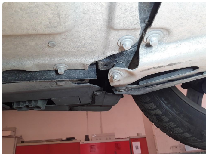
1.2 Noe skadet aluplate og bøyd feste.