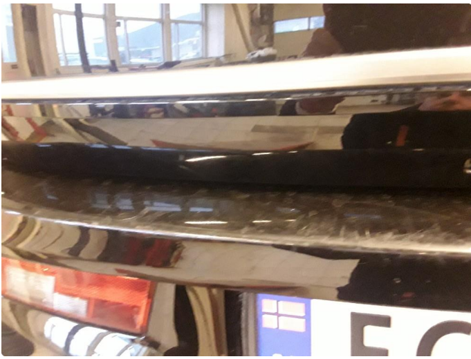
1.4 Noen riper og sår bak.