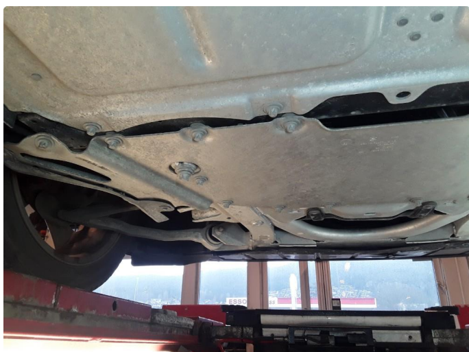
1.2 Noe skadet aluplate og bøyd feste.