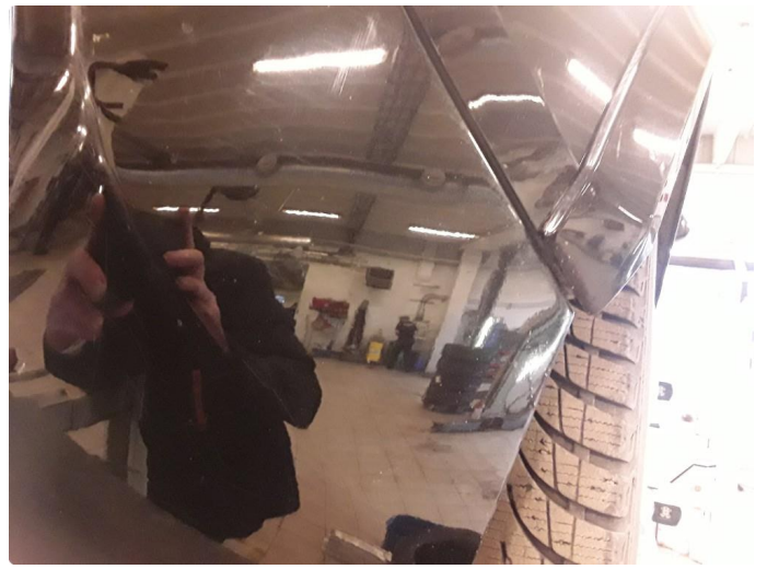
1.4 Noen riper og sår bak.