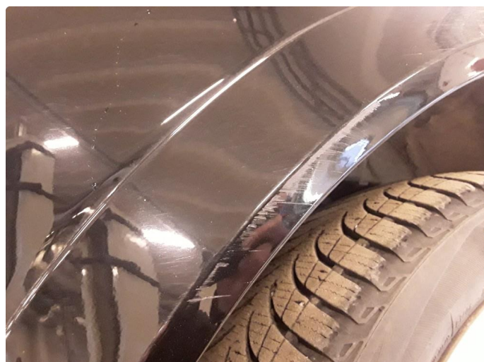
1.3 Riper høyre bak.