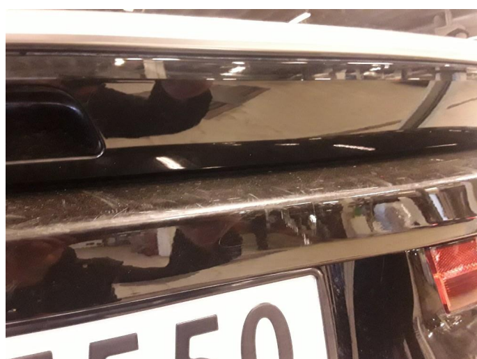
1.4 Noen riper og sår bak.