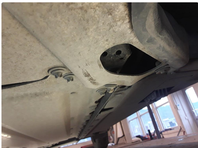
1.2 Noe skadet aluplate og bøyd feste.