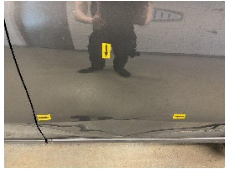
27. Lakk / karosseri utvendig