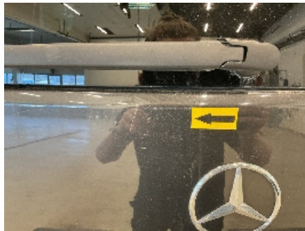
29. Lakk / karosseri utvendig