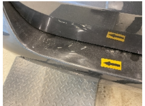
30. Lakk / karosseri utvendig