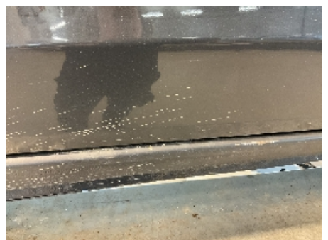
36. Lakk / karosseri utvendig