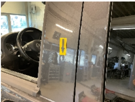
31. Lakk / karosseri utvendig