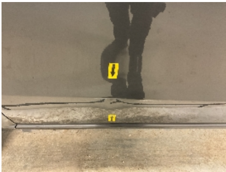
28. Lakk / karosseri utvendig