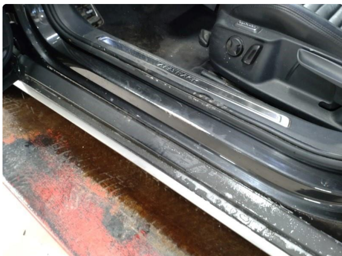
1.1 Slitt gjennom lakk