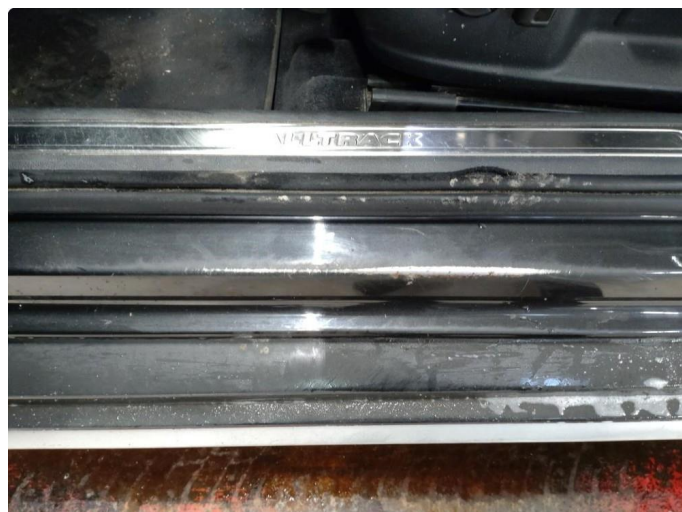
1.1 Slitt gjennom lakk