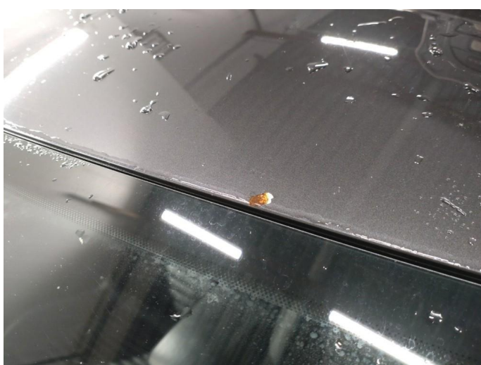
1.4 Steinsprut med rust