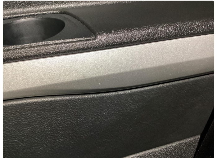
3.1 Ripe(r) normal bruktslitasje