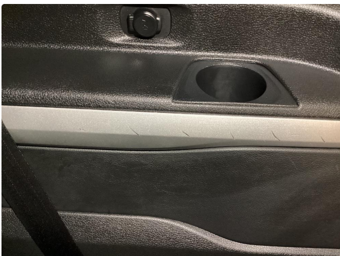
3.1 Ripe(r) normal bruktslitasje