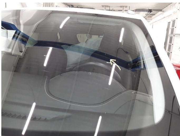
1.7 Noe steinslag i frontruten.