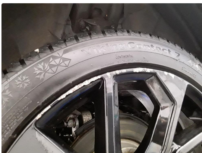
1.6 Høyre vinterfelg er stygt oppskrapet. Smartrep.lakkeres.