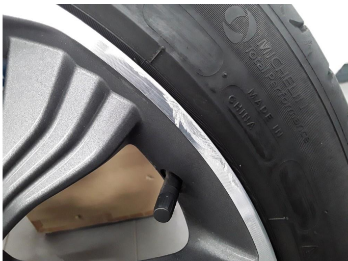
1.5 Noe kantskade på felg(er)