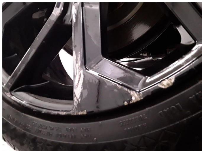
1.6 Høyre vinterfelg er stygt oppskrapet. Smartrep.lakkeres.