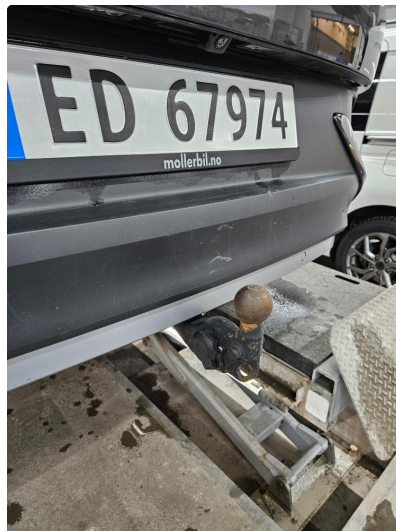
1.3 Noen riper nede på plast-bakfanger