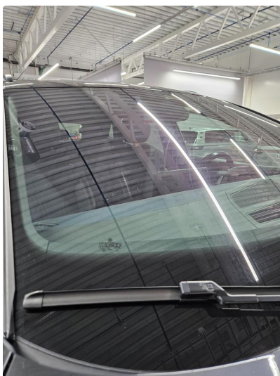
1.4 Noe steinsprut