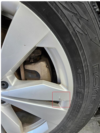
1.1 Liten skrubb på en alu. vinterfelg