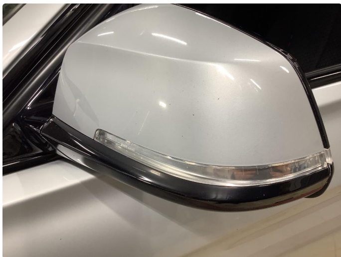
1.5 Speilhus riper