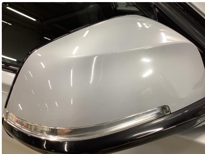
1.5 Speilhus riper