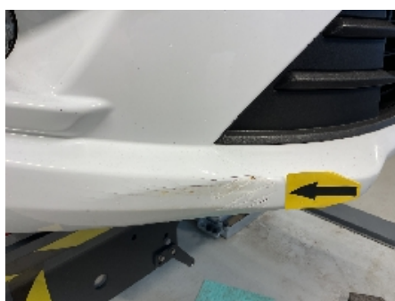
47. Lakk / karosseri utvendig