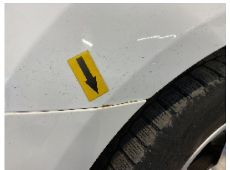
30. Lakk / karosseri utvendig