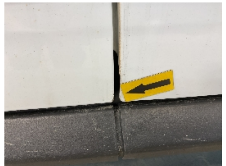
33. Lakk / karosseri utvendig