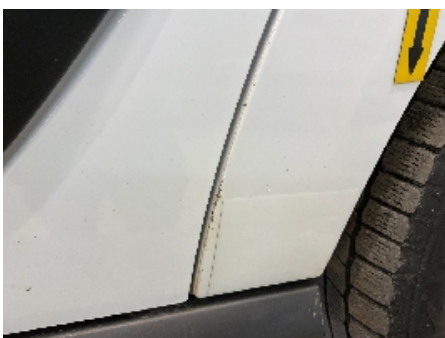
34. Lakk / karosseri utvendig