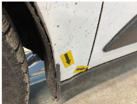
32. Lakk / karosseri utvendig