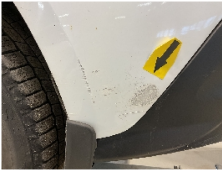
37. Lakk / karosseri utvendig