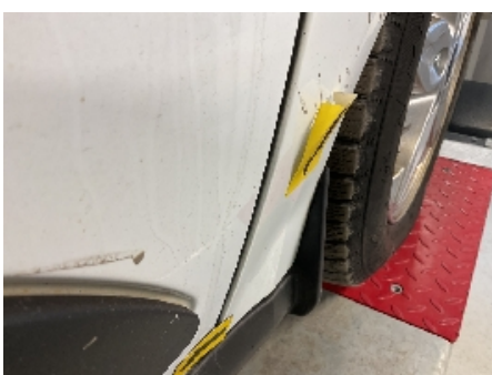
46. Lakk / karosseri utvendig