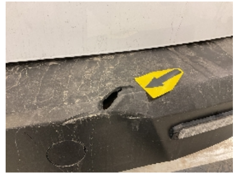
39. Lakk / karosseri utvendig