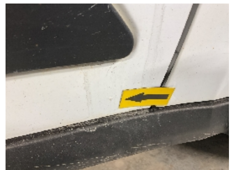
45. Lakk / karosseri utvendig