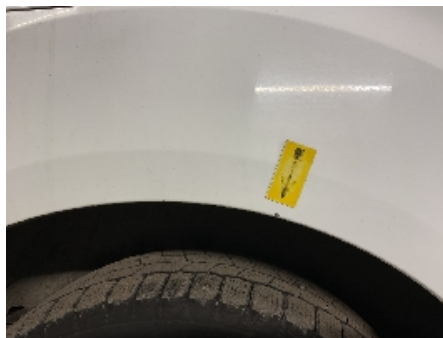
41. Lakk / karosseri utvendig