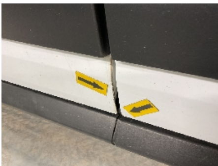
43. Lakk / karosseri utvendig