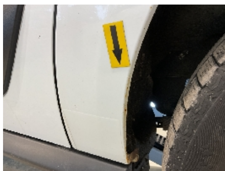
35. Lakk / karosseri utvendig