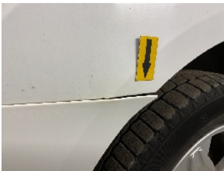
40. Lakk / karosseri utvendig