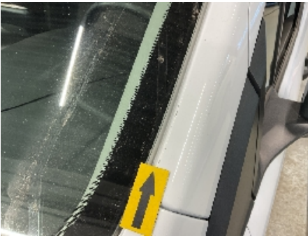
49. Lakk / karosseri utvendig