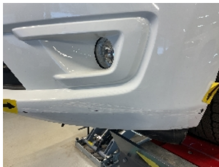
29. Lakk / karosseri utvendig