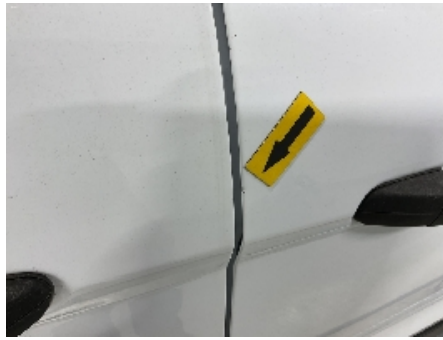
50. Lakk / karosseri utvendig