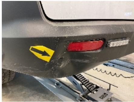
38. Lakk / karosseri utvendig