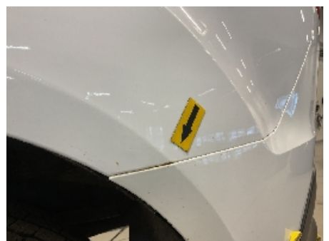
36. Lakk / karosseri utvendig