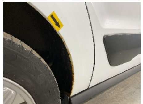
42. Lakk / karosseri utvendig