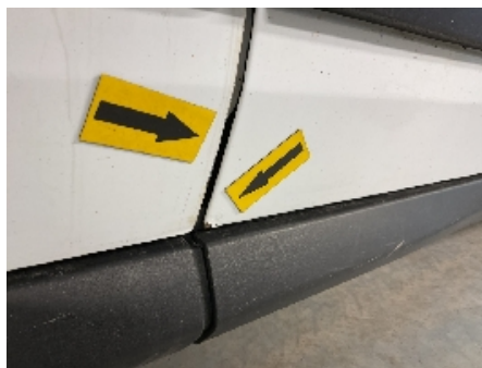
44. Lakk / karosseri utvendig