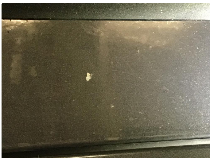
2.1 Steinsprut med rust