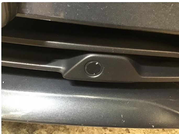
1.1 Øvrige feil ( steinsprut )