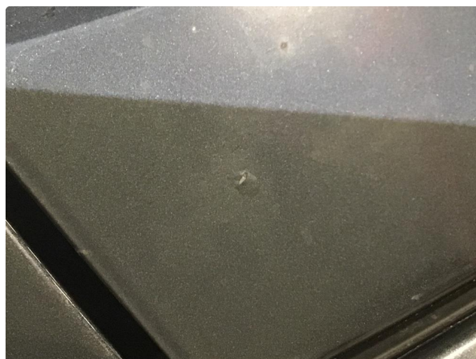
2.1 Steinsprut med rust