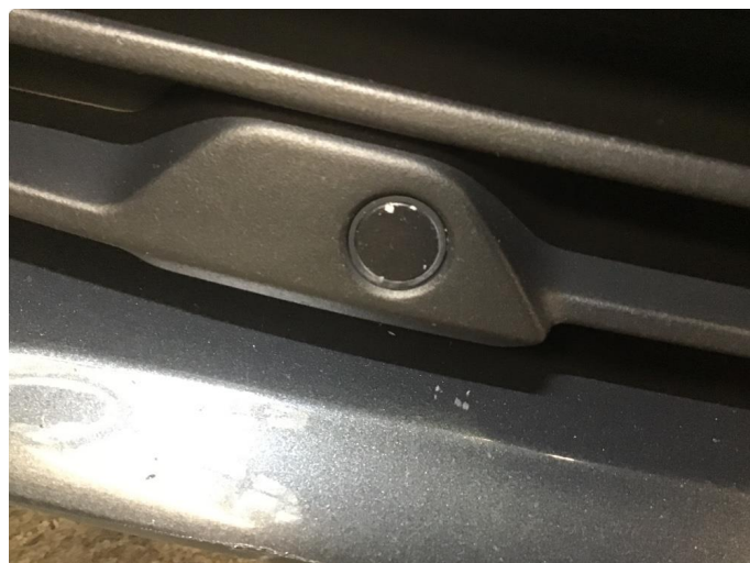
1.1 Øvrige feil ( steinsprut )