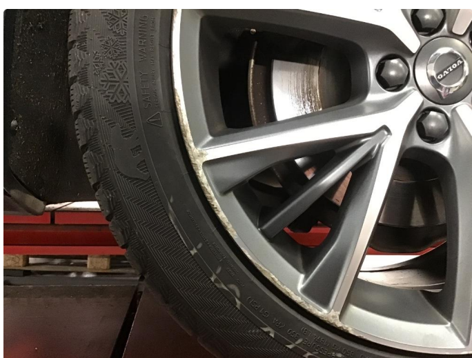
2.2 Kantkjørt felg