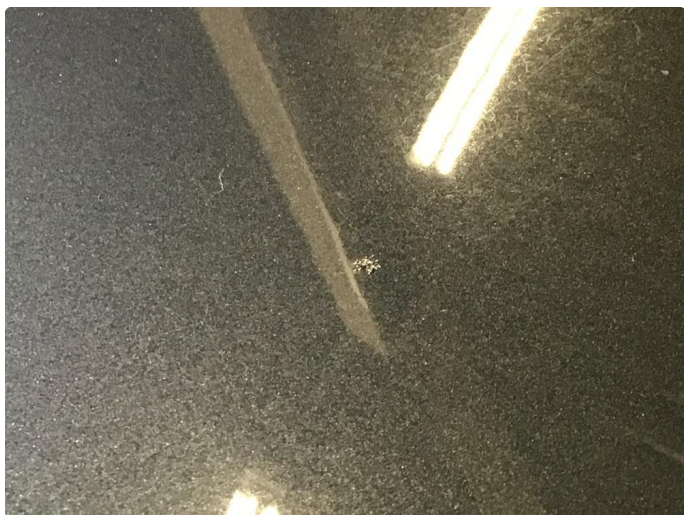
2.5 Steinsprut med rust