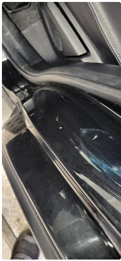
1.5 Noen riper og småbulker