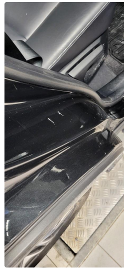
1.5 Noen riper og småbulker