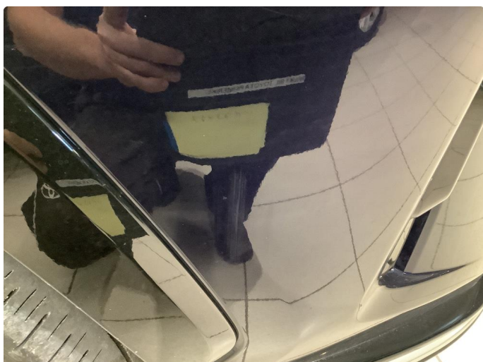
1.1 Ripe(r) ned til grunning