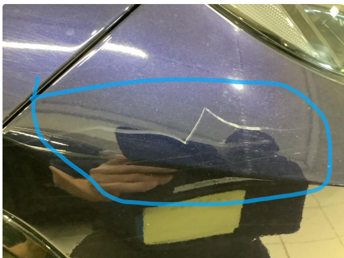
1.1 Ripe(r) ned til grunning