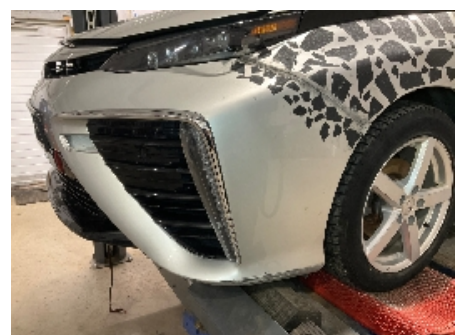
12. Lakk / karosseri utvendig