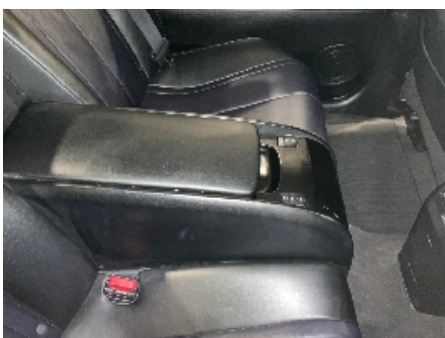
4. Dashbord / midtkonsoll