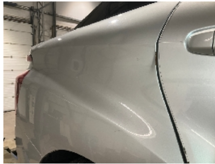
14. Lakk / karosseri utvendig