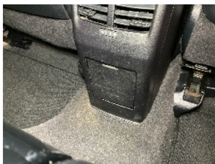
5. Dashbord / midtkonsoll