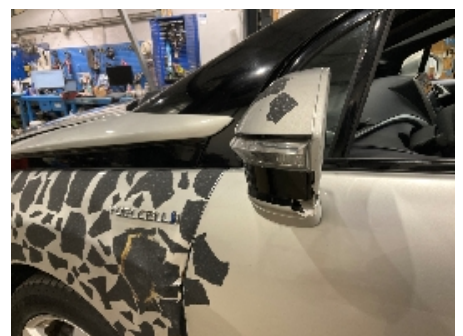
9. Utvendig speil