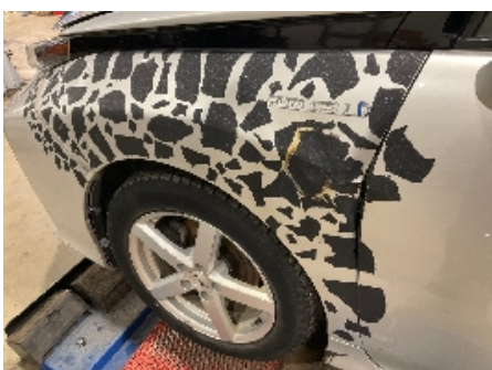
10. Lakk / karosseri utvendig