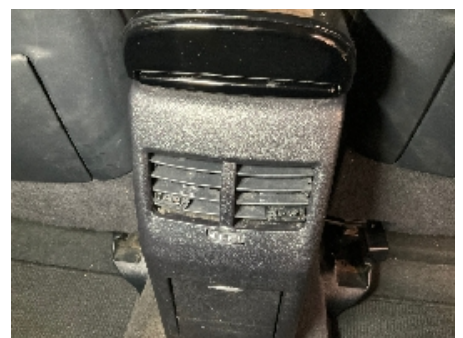
6. Luftdyse kupé