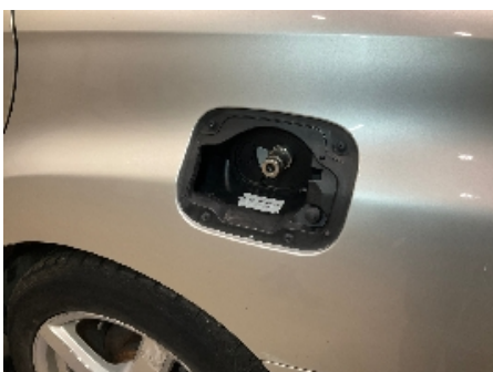
7. Drivstofftank, rør, slange