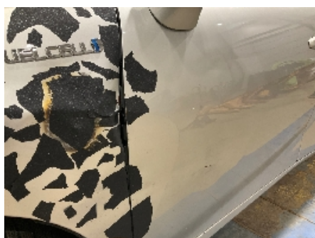
11. Lakk / karosseri utvendig