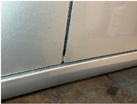
13. Lakk / karosseri utvendig