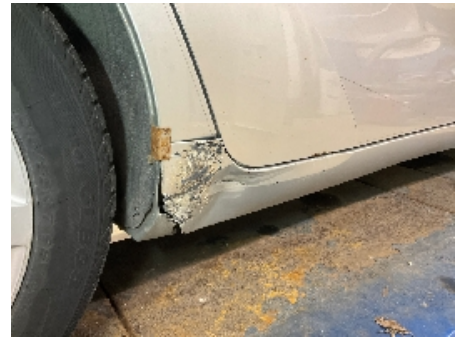
15. Lakk / karosseri utvendig