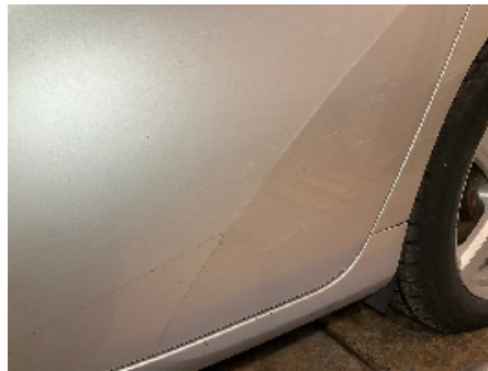
17. Lakk / karosseri utvendig