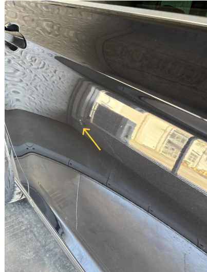
1.2 Liten ripe i lakk, høyre bakdør