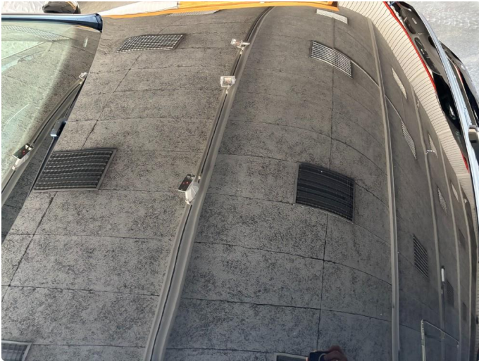
1.1 Noe steinsprang