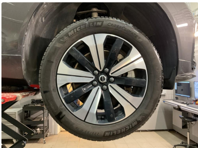
1.1 Bilde av felger