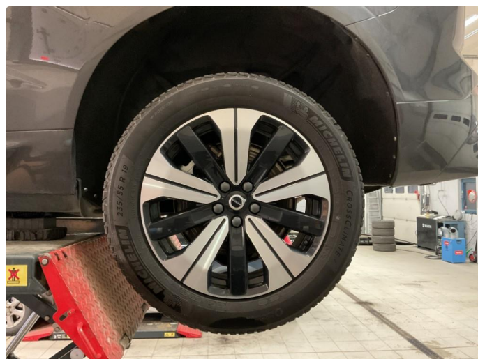
1.1 Bilde av felger