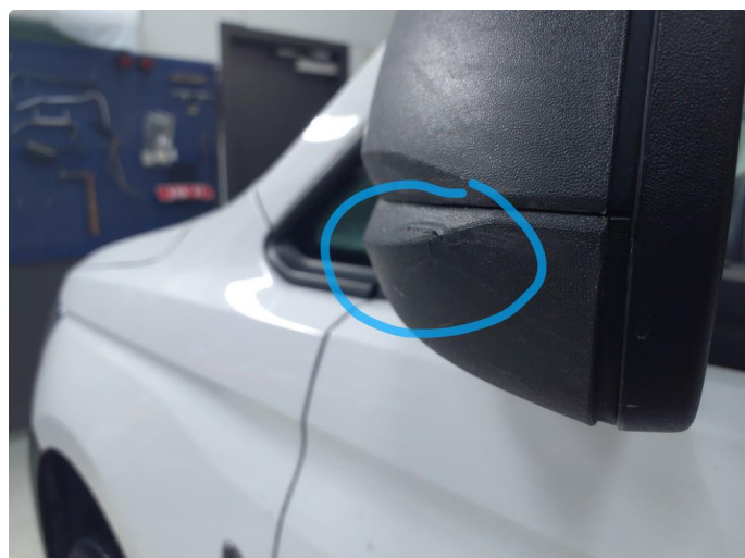
1.2 Speilhus riper