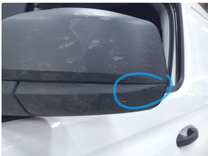
1.2 Speilhus riper