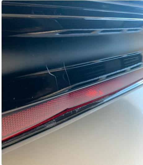
1.2 Noen små riper nedre del bak.