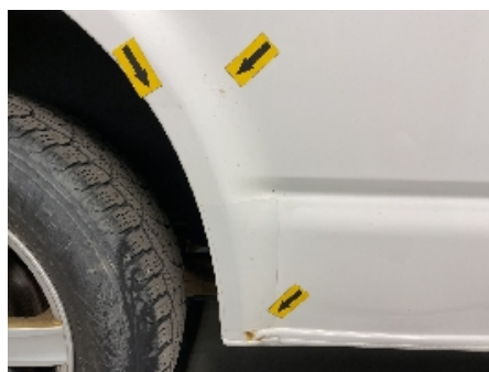
23. Lakk / karosseri utvendig