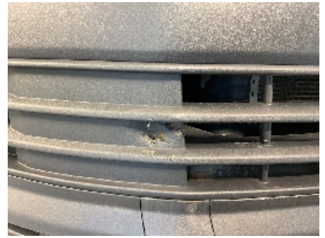
39. Lakk / karosseri utvendig