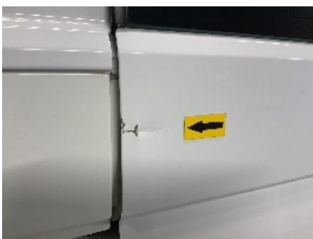
22. Lakk / karosseri utvendig