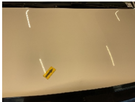
20. Lakk / karosseri utvendig