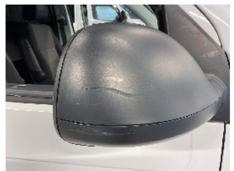
48. Utvendig speil