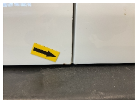
24. Lakk / karosseri utvendig