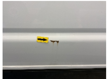
30. Lakk / karosseri utvendig