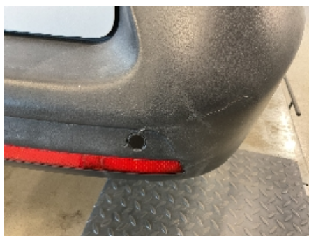
47. Lakk / karosseri utvendig