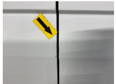
21. Lakk / karosseri utvendig