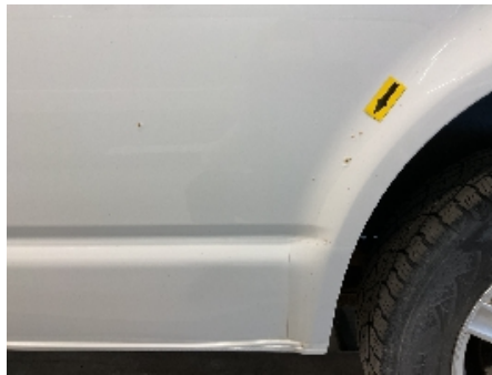
29. Lakk / karosseri utvendig