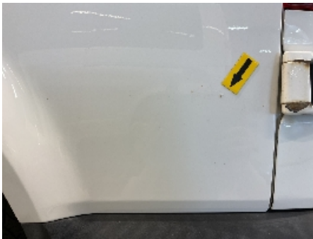
28. Lakk / karosseri utvendig