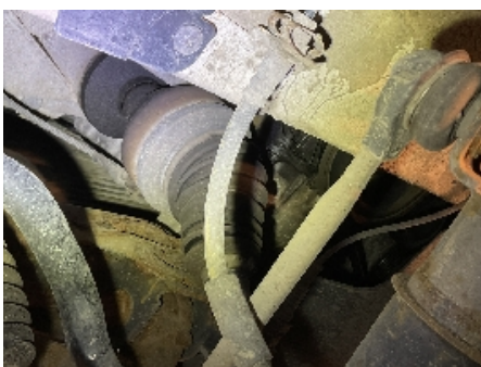
46. Utvendig tilstand motor