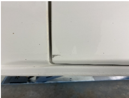
40. Lakk / karosseri utvendig