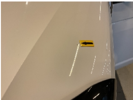
19. Lakk / karosseri utvendig